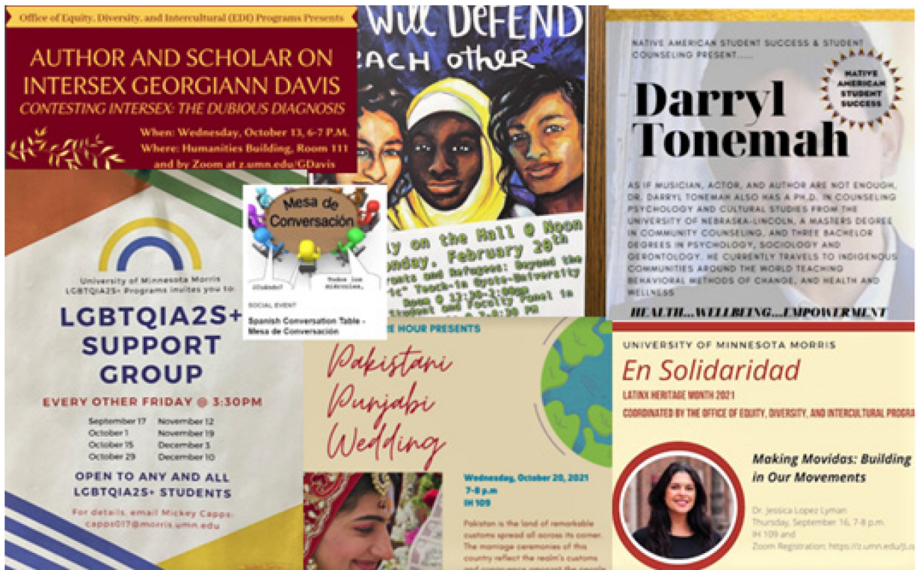
KUVA 4. Esimerkkejä yliopiston kampuksella järjestettävistä tapahtumista [7]

Kuluvan viikon aikana minulla on mahdollisuus olla osallisena ainakin seuraavissa tapahtumissa: