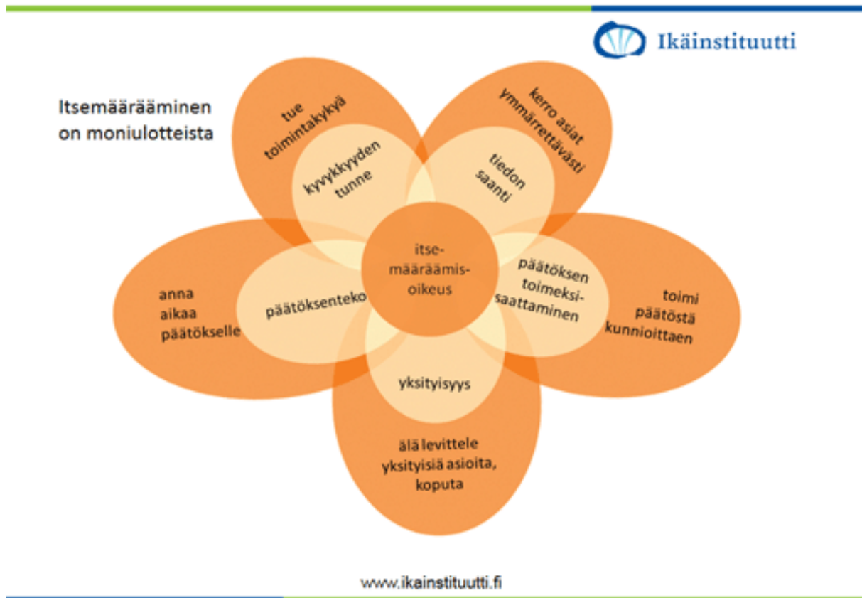
Kuvio 2. Itsemäärääminen on moniulotteista. (Itsemääräämisoikeus keskeistä ikäihmisten kotona pärjäämiselle 2015.)

vakaumuksen ja yksityisyyden tulleen arvostetuksi. (Potilaan oikeudet.) Arvokas kohtelu on tärkeää myös kotiutuksen yhteydessä. Potilaalle kuuluu antaa tiedot hänen terveydentilaansa liittyen, hoidon merkityksestä, eri hoitovaihtoehdoista ja niiden vaikutuksista potilaan hoitoon liittyen. (Potilaan oikeudet).