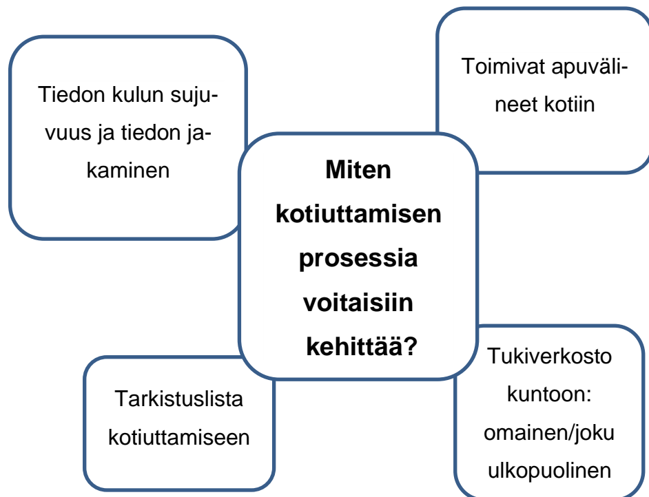
Kuva 1. Miten kotiuttamisen prosessia voitaisiin kehittää?

Haastateltavan äänestä oli havaittavissa epävarmuutta ja itsekseen pohdintaa asiaan liittyen.