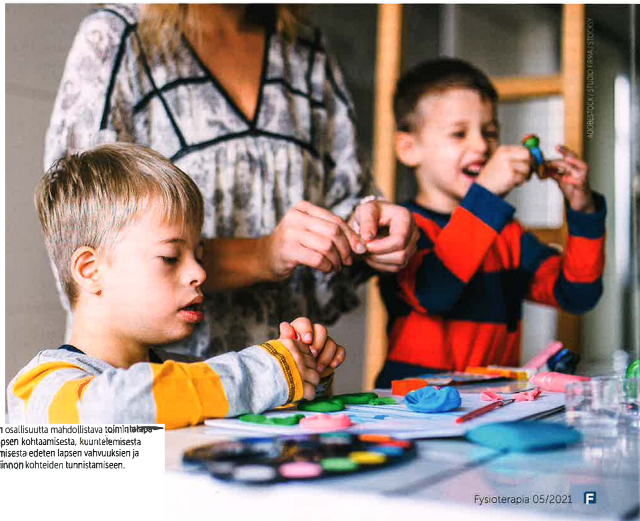
Aikuisten osallisuutta mahdollistava toimintatapa lähtee lapsen kohtaamisesta, kuuntelemisesta ja kuulemisesta edeten lapsen vahvuuksien ja mielenkiinnon kohteiden tunnistamiseen.

Erityistä tukea tarvitsevan lapsen osallisuuden rakentumisessa aikuiset ovat keskeisessä asemassa. Tässä Anu Kinnusen väitöstutkimukseen pohjautuvassa artikkelissa kuvataan toimintatapoja lapsen osallisuuden mahdollistamiseksi.