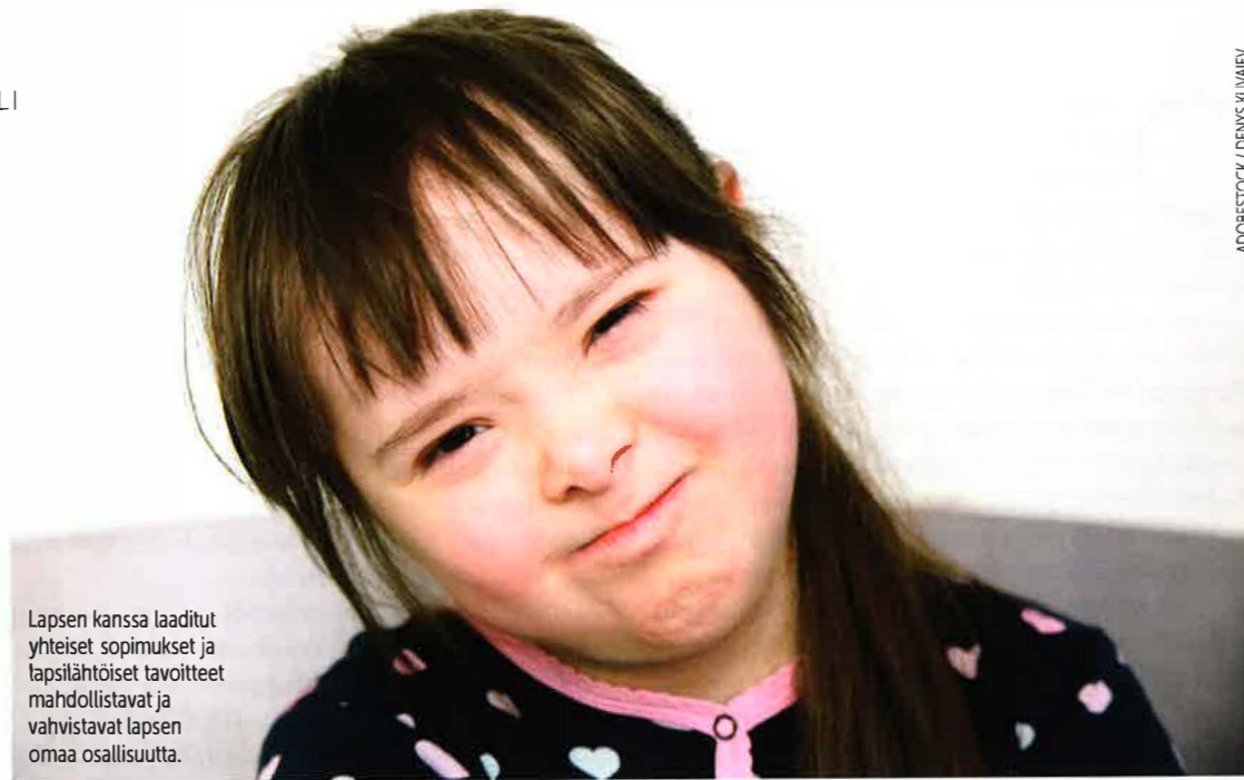
Lapsen kanssa laaditut yhteiset sopimukset ja lapsilähtöiset tavoitteet mahdollistavat ja vahvistavat lapsen omaa osallisuutta.