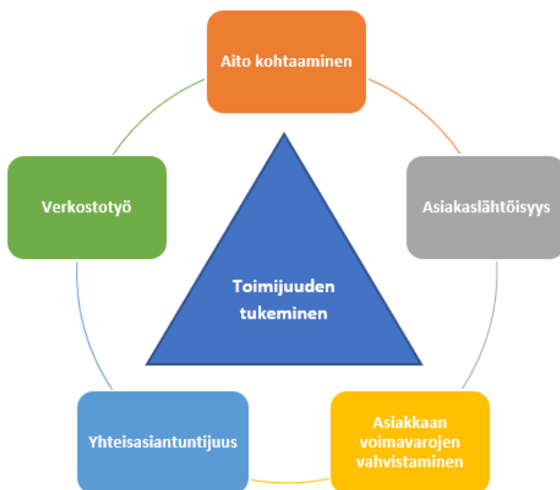
Kuvio 5. Keinoja toimijuuden tukemiseen työntekijöiden kokemana

Alla yhteenveto projektin työntekijöiden kokemuksista eri keinoista asiakkaan toimijuuden tukemiseen (kuvio 5).