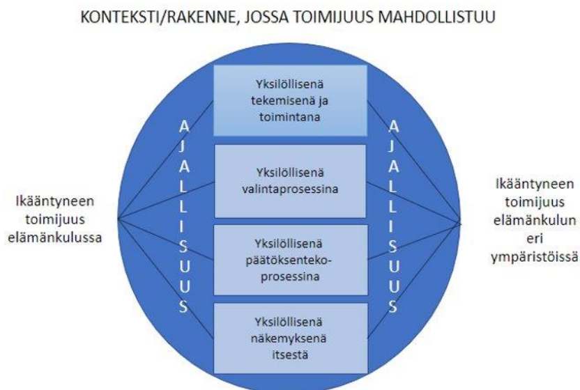
Kuvio 3. Ikääntyneen aikuisen toimijuuden mahdollistuminen kuntoutuksessa soveltaen SCSC-lähestymistapaa toimijuuteen (mukaillen Pikkarainen 2020: 76).

mijuus rakentuu elämänkulun aikana ja se muotoutuu ihmisen henkilökohtaisessa elämässä. Ihminen nähdään subjektina, joka toimii, tekee valintoja ja päätöksiä sekä muokkaa näkemyksiä itsestään suhteessa menneisyyteen, nykyisyyteen ja tulevaisuuteen sekä suhteessa ympäröivään maailmaan. (Pikkarainen 2020: 75–76).