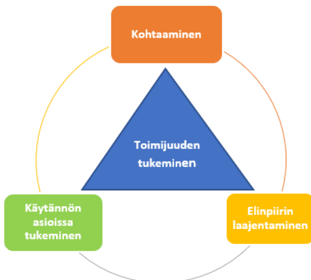
Kuvio 4. Keinoja toimijuuden tukemiseen haastateltavien kokemana

Etsivän vanhustyön haastateltavat asiakkaat kokivat kohtaamisen, käytännön asioissa tukemisen ja elinpiirin laajentamisen tukevan heidän toimijuuttaan (kuvio 4).