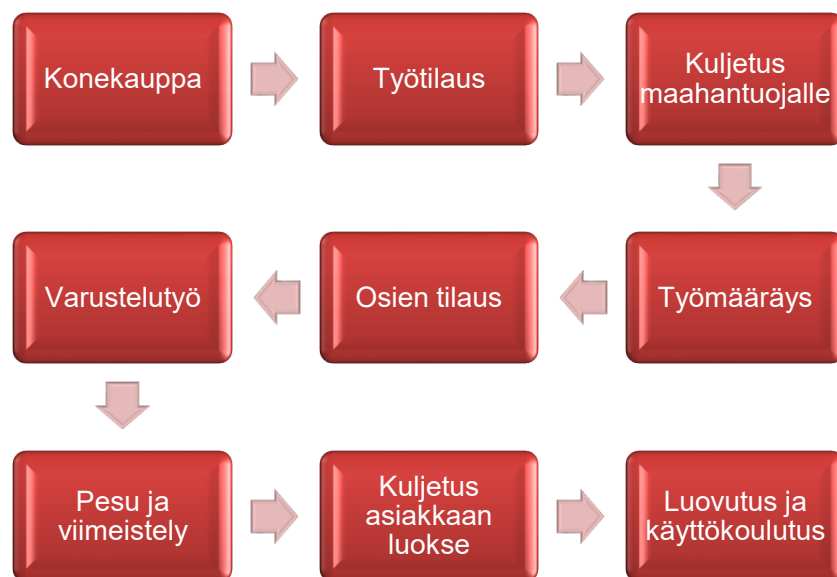
Kuva 1. Nykyinen varusteluprosessi vaihemallina esitettynä.

Tässä insinööriyössä kuvattu prosessi on erään työkoneita maahantuovan yrityksen nykyinen varusteluprosessi. Konemyynti, varaosamynti sekä korjaamo osallistuvat yhdessä varusteluprosessiin. Jokainen osa-alue on tärkeä, ja jokaista osaa tarvitaan, jotta varusteluprosessi on mahdollinen. Kuvassa 1 on esitetty yrityksen nykyinen varusteluprosessi vaihemallina.