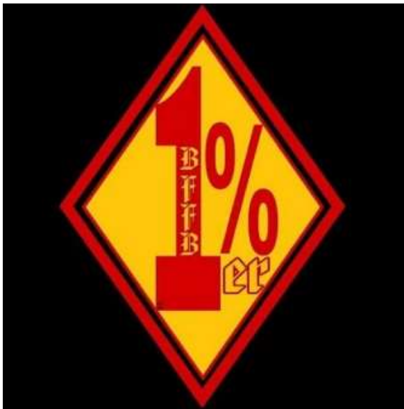
Prosenttimerkki Bandidos MC-väreissä. http://www.bandidos-mc.se/1er-2/

Myöhemmin The American Motorcycle association (AMA), joka tunnetaan suomalaisittain, Amerikkalainen moottoripyöräilijöiden yhdistys, otti kantaa tapahtuneeseen antamalla Life Magazinellem lausunnon, jonka mukaan kaikista moottoripyöräilijöistä vain yhtä prosenttia voidaan pitää lainvastaisina ja loput yhdeksänkymmentyhdeksän prosenttia ovat lakia noudattavia kansalaisia. Tästä innostuneena suuret moottoripyöräkerhot, alkoivat käyttää liiveissään tunnusta 1 %.