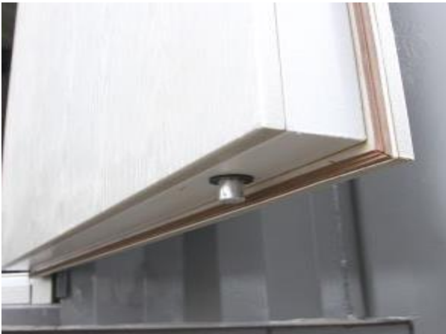
Kuva 4: Turvaoven alareuna