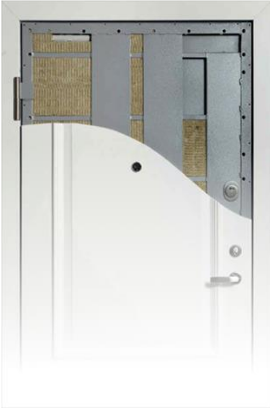
Kuva 3: Kaso-turvaoven runko