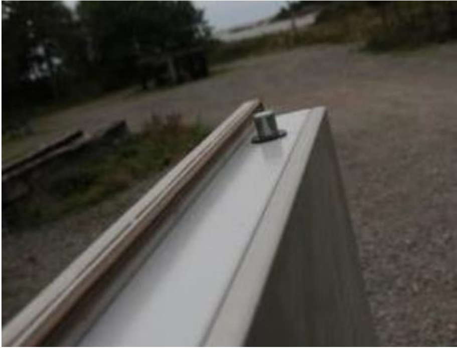
Kuva 5: Turvaoven yläreuna