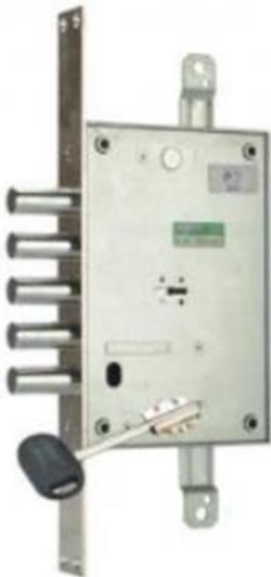
Kuva 6: Turvalukko

(Tästä kappaleesta on poistettu osio TL IV perusteella)