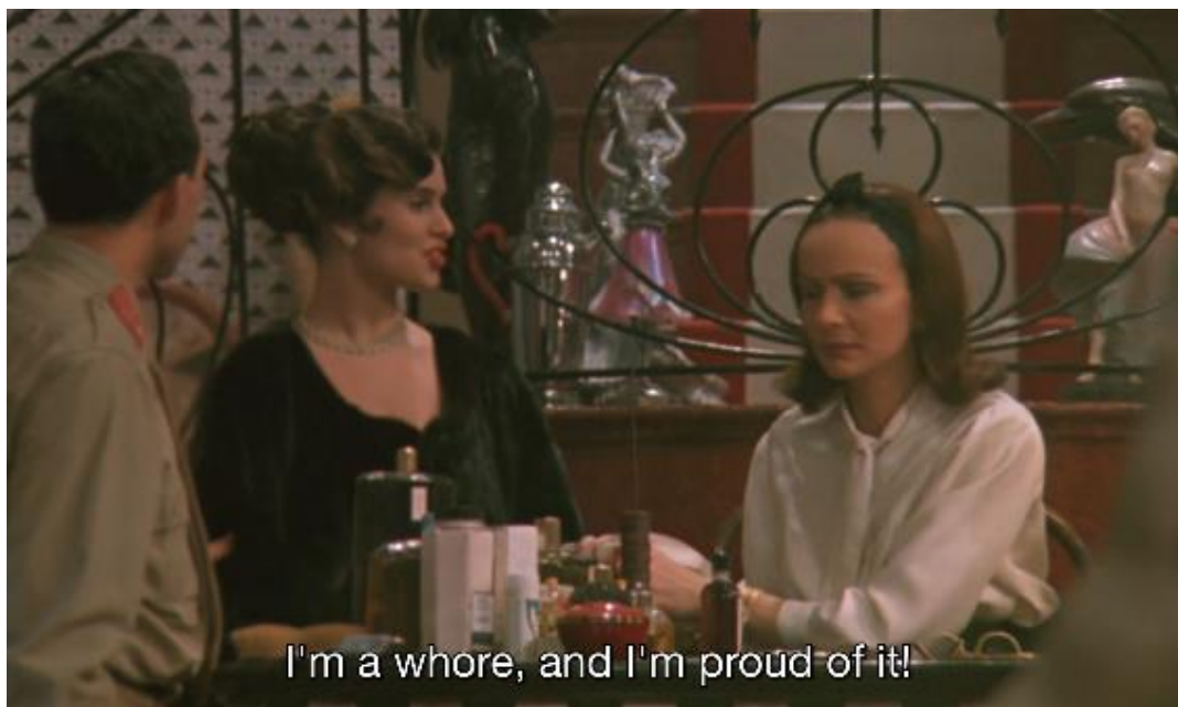
KUVA 1: Paprika Tinto Brassin elokuvan loppukohtauksessa (Paprika, 1991)

Lukas Moodyssonin vuonna 2015 ohjaamassa Lilja 4-ever elokuvassa taas käsitellään sekä vapaaehtoista seksin myymistä, sekä seksiorjaksi joutumista. Liljan äidin lähdettyä Yhdysvaltoihin, Lilja alkaa myymään seksiä elättääkseen itseään. Hänet huijataan matkustamaan Ruotsiin töitä lupailen, jossa hän päätyykin seksityöntekijäksi vasten tahtoansa. Elokuvassa on mielestäni esitetty hienosti molemmat puolet seksityöstä. Teoksessa kerrotaan hienosti mikä on omasta tahdosta tehdyn seksityön, ja pakotetun seksityön ero. Ihmiskaupan uhrina Liljalla ei ole enää vapautta ja mahdollisuutta valita asiakkaitansa tai suunnitella oman työnsä aikatauluja. Niin ja mikä tärkeintä, hän ei saa palkkaa tekemästensä työstä.