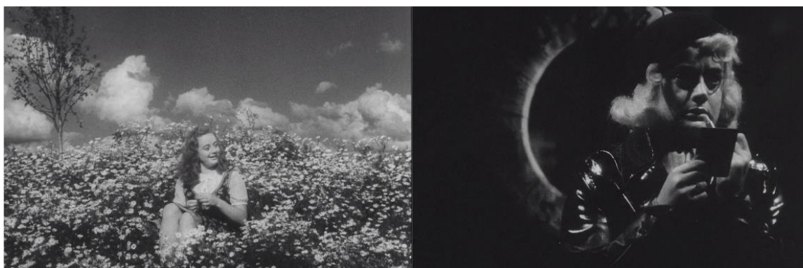
KUVA 2. Maija elokuvan alku- ja loppukohtauksissa (Sellaisena kuin sinä minut halusit 1944)

Alla olevassa kuvaesimerkissä pystyy hyvin näkemään suuren eron Maijan kuvauksessa elokuvan alussa ja lopussa. Elokuvan alkukohtauksessa Maija kuvataan viattomasti kukkapellon keskellä odottamassa sulhastaan. Hänen olemuksensa on raikas ja iloinen. Elokuvan loppukohtauksessa Maija on satamassa etsimässä asiakkaita, hänet kuvataan paljon varjoisammassa näkökulmassa, ja hänen olemuksensa on synkkä ja karu (kuva 2).