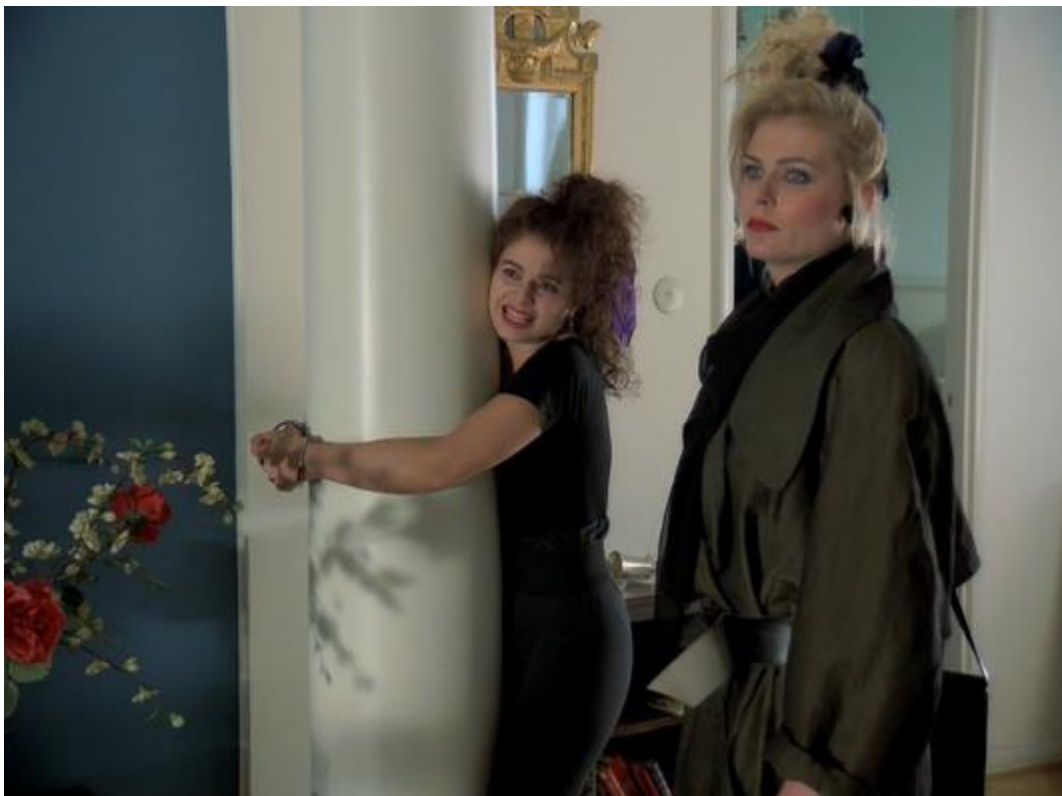
KUVA 5: Assi kiinnitettyinä käsiraudoilla kiinni Annan kotona (Paperitähhti 1989)