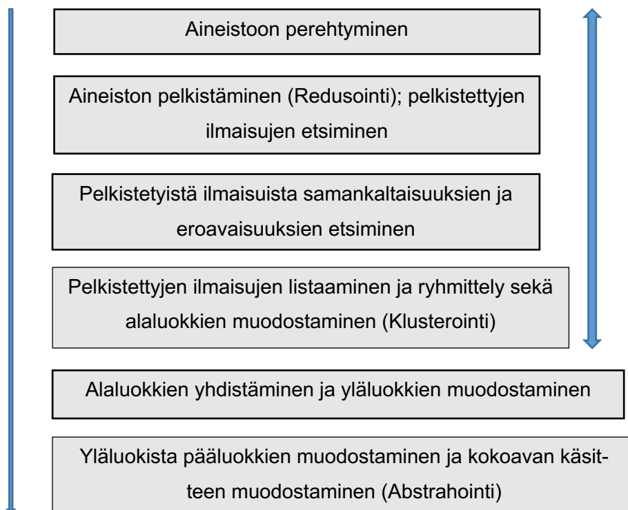
Kuva 2. Aineistoanalyysipolku mukailten Tuomi & Sarajärvi (2018).

Aineiston pelkistämisen ja pelkistettyjen ilmaisujen listauksen sekä ryhmittely ja luokittelu suoritettiin toistuvasti aineiston laajuuden takia. Tämän jälkeen aineistosta luotiin tutkimuskohdetta kuvaava kokoava käsittekokonaisuus, josta enemmän luvuissa 8 tulokset ja 9 johtopäätökset.