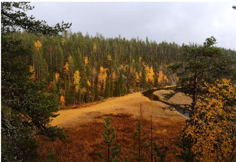
Kuva 16. Kosteä päivä Ylläksen Äkäsaivossa, Juho Haveri-Heikkilä