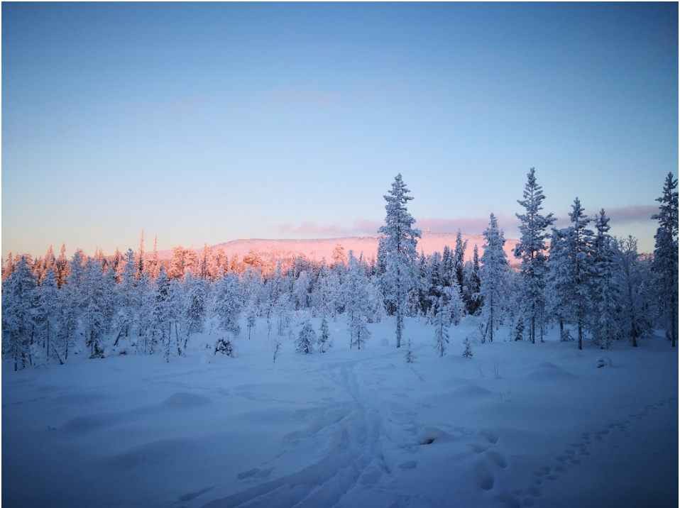
Kuva 12. Hiihtovaellus Luoston Pyhälätva-aavalla

Seuraavaksi esittelen kuvin ja sanoin eri vuodenaikoina tehtäviä aktiviteettejä suoelinympäristöissä. Omaan suokokemukseemme vaikuttavat lähiympäristömme missä olemme asuneet ja millaisia kokemuksia meillä on ja mistä näkökulmasta me niitä lähestymme esimerkiksi virkistyksen lähteenä tai tuotantoympäristönä. (Kivelä A 2006) Kuvat kertovat minun kokemukseni suosta ja sen hyödyntämisestä eri vuodenaikoina.