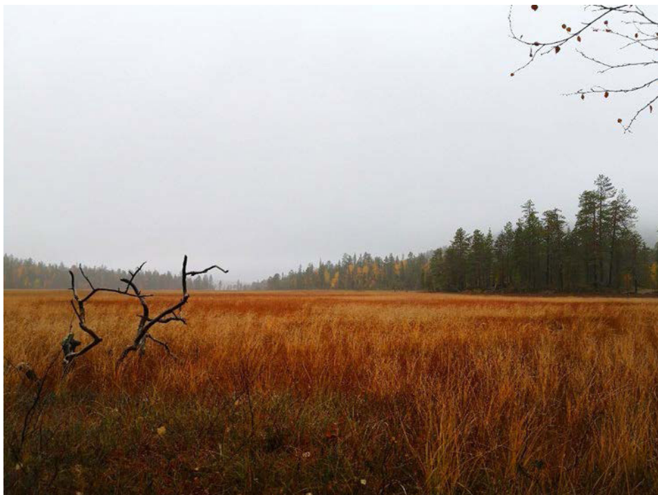
Kuva 1. Sumu ja ruska luovat mystisen tunnelman suolle, Juho Haveri-Heikkilä

Suo on aina ollut suomalaisille mystinen paikka, josta on huokunut eräänlainen väli-maailmanhenki, kuolema ja sairaudet. Suo ei ole ollut kunnolla elävien eikä kuolleiden paikka, joka on koettu pelottavana paikkana, mutta se on myös kutsunut ja houkuttellut kulkijaa. (kuva 1) Monet kertomukset ja taruolennot liittyvät oleellisesti suolla koettuun mystiikkaan ja houkuttelevuuteen. Suo on koettu jonkinlaisena mitättömänä paikkana, joka tuli ihmisen valjastaa, jotta siitä olisi jotain hyötyä kuten viljelysmaaksi tai pelloksi. Suo on tarjonnut myös aarteita suomalaisin, marjojen ja parantavien yrttien muodossa sekä antanut suojapaikan sitä tarvitseville.