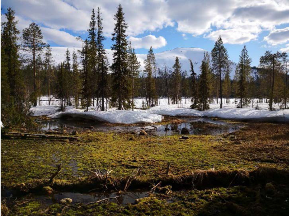
Kuva 14. Keväällä suon lähde herättää elinympäristön eloon (Ylläs), Juho Haveri-Heikkilä

lämmittäessä poskia. Keväällä voidaan kerätä talven yli säilyneitä karpaloita, jotka ovat makeampia kuin syksyisin kerätyt.