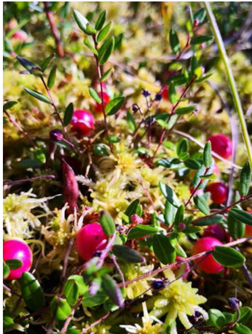
Kuva 10. Karpalo on nevojen tyypillinen kasvi, Juho Haveri-Heikkilä

Nevat ovat avoimia soita, joilla väli- tai rimpipinnat ovat vallitsevia kosteus tasoja, eli pohjaveden pinta sijaitsee lähellä suon pintaa. Nevat ovat sarakasvien ja rahkasammalten valtakuntaa, jossa viihtyy myös karpalo (kuva 10).