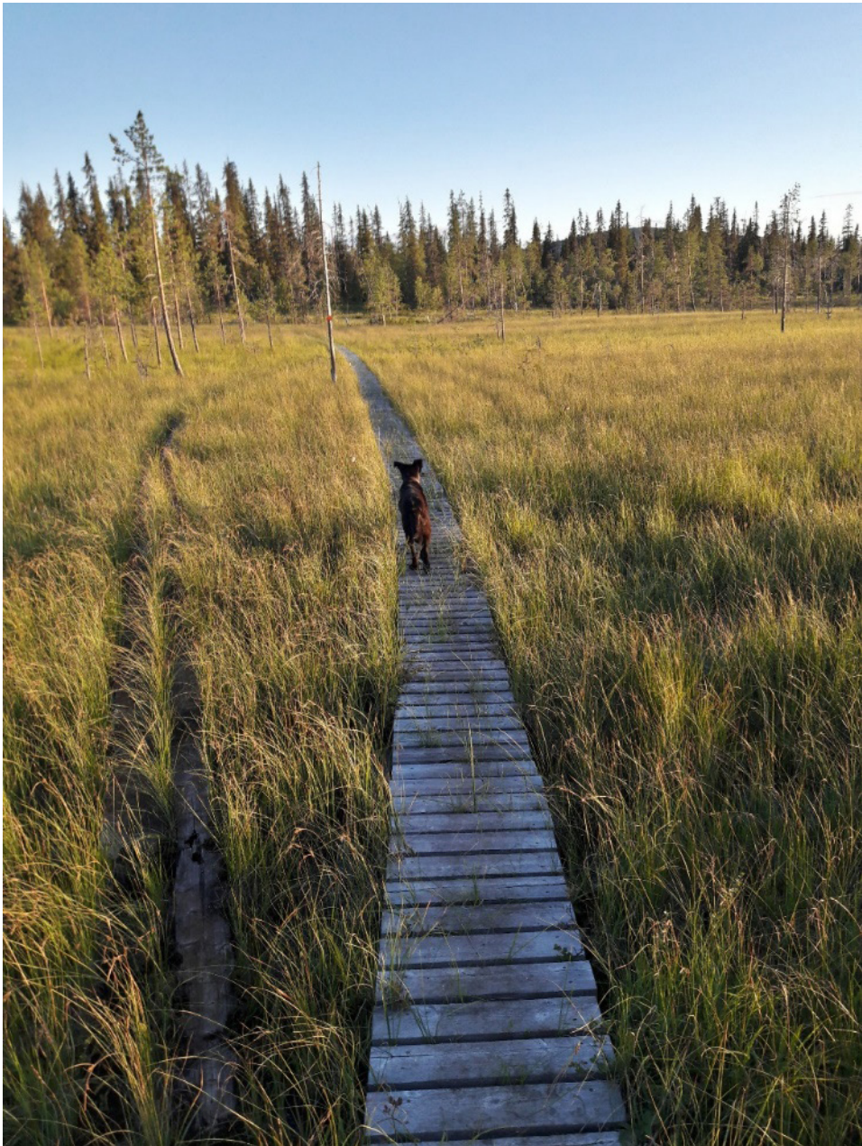
Kuva 15. Pitkospuut kuljettavat matkaajan suon yli Sallassa, Juho Haveri-Heikkilä

Syksyisin kiireisen kesän jälkeen on hyvä lähteä suolle vaeltamaan. Syksyisin soiden väri kirjo herää eloon ja saa aistit hereille. (kuva 17) Myöhemmin syksyllä sumuisen kosteat päivät luovat mystisen tunnelman. (kuva 16) Lokakuun alkupuolella ensimmäisten pakkasten jälkeen karpalot ovat valmiita kerättäväksi talven varaksi.