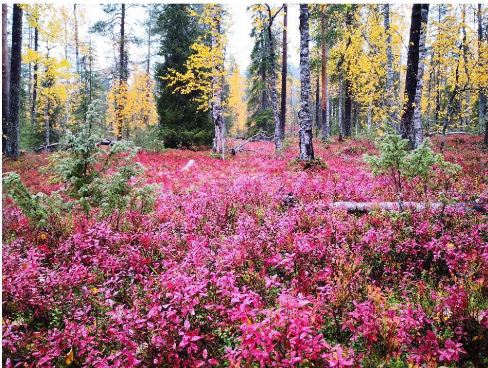
Kuva 17. Suon laidassa juolukoiden väriloistoa, Juho Haveri-Heikkilä