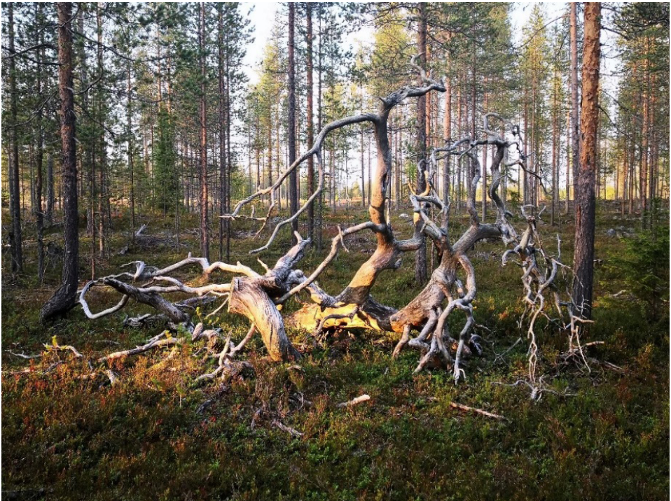
Kuva 2. Kelo suon ja kankaan välimaastossa, Juho Haveri-Heikkilä

Suomalaisessa kansanperinteessä on kerrottu paljon myyttejä aarnivalkeista, aarnihaudoista ja aarnikrateista. Kansanperinteessä on kerrottu aarteista, jotka on piilotettu suohon. Uskottiin, että aarteiden olinpaikkaa on ilmentäneet virvaliekit eli aarnivalkeat veden tai suonpinnan tuntumassa. (Pulkkinen & Lindfors 2016, 7) Niiden olinpaikkoja on myös yhdistäneet hiljaiset hetket asumattomilla alueilla. (kuva 3) Uskottiin, että virvaliekit harhaanjohtivat kulkijaa ja katosivat kun niitä lähestyi tai kulkija oli liian äänekäs (kuva 2). (Suomen luonto 2017)