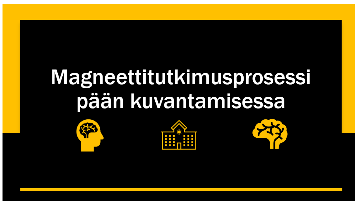
KUVA 2. Esimerkki diaesitysten ulkoasusta.

PowerPoint-esitysten ulkoasuun valittiin oranssin sävyä. Taustan väriksi valittiin musta luettavuuden ja tekijän omien esteettisten mieltymysten perusteella (kuva 2). Testien värimaailmaan ei pystynyt vaikuttamaan.