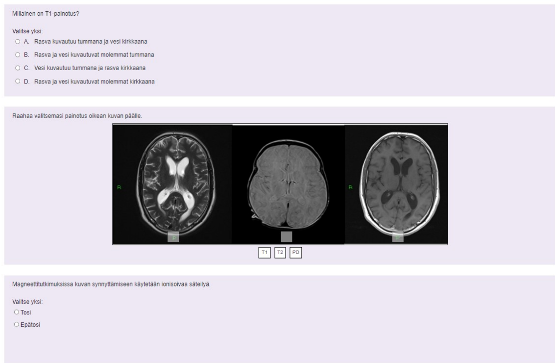
KUVA 3. Verkkokurssin testin sisältöä.

Verkkokurssin testien kysymykset laadittiin PowerPoint-esityksissä opetetun tiedon perusteella. Testit olivat viiden kysymyksen pituisia, lyhyitä ja ytimekkäitä, ja ne sisälsivät monivalintakysymyksiä, tosi/epätosi -väittämiä sekä yhdistelytehtäviä (kuva 3). Testejä voi suorittaa uudestaan rajattomasti ja niiden kysymykset valikoituvat satunnaisesti kysymyspankista. Testien läpäisyyn vaaditaan oikea vastaus jokaisesta kohdasta. Opiskelija saa testin palautettuaan pisteellisen arvon suorituksestaan sekä näkee oikeat vastaukset. Keränen ja Penttinen (2007, 140) kertovat kirjassaan, että monivalintatehtävien avulla ei voida todeta opiskelijan syvällistä osaamista, mutta ne kuitenkin havainnollistavat aiheeseen liittyvän teorian tiedon tuntemuksen ja oppimateriaalin hallinnan. Testit antavat opiskelijalle palautetta hänen omasta osaamisestaan ja toimivat objektiivisena arviointivälineenä. (Keränen & Penttinen 2007, 140.)