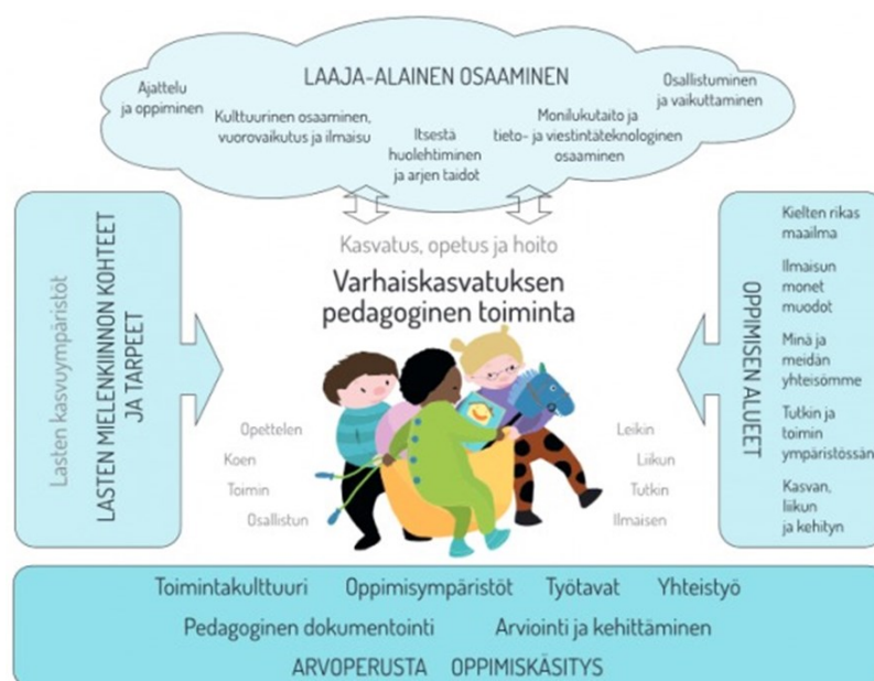
KUVA 7. Oppimisen alueet ja laaja-alainen osaaminen (Kuopion kaupunki 2019).

Seuraavaksi lapsen varhaiskasvatukselle kirjataan yhdestä kahteen tavoitetta. Nämä tavoitteet nousevat varhaiskasvatussuunnitelman perusteista; oppimisen alueista ja laaja-alaisen osaamisen osa-alueista (kuva 7). (Oph 2020.) Oppimisen alueet koostuvat viidestä alueesta: Kielten rikas maailma-, Ilmaisun monet muodot-, Tutkin ja toimin ympäristössäni-, Minä ja meidän yhteisömme- sekä Kasvan, liikun ja kehityn -alueesta. Nämä alueet sisältävät muun muassa eettistä ajattelua, matemaattista ajattelua, ruokakasvatusta, kielellisiä taitoja, musiikillista ilmaisua, katsomuskasvatusta ja liikunnista. Laaja-alainen osaaminen koostuu muun muassa monilukutaidosta, itsestä huolehtimisesta ja arjen muista taidoista. Lisäksi kulttuurinen osaaminen ja vuorovaikutustaidot, itsensä ilmaisu ovat merkityksellisiä monimuotoisessa maailmassamme. Hyvä ja laadukas varhaiskasvatusta antaa vankan pohjan näiden taitojen ja tietojen kehittymiselle. (Kola-Torvinen 2019, 12–14.) Tavoitteita miettiessä on hyvä pohtia mitä taitoa lapsen halutaan kehittävän tai saavuttavan, ja miksi juuri tämä tavoite on oleellinen lapsen kasvun kannalta. Tavoitteiden tulee olla lapselle tarpeellisia, oikeanaikaisia, sopivankokoisia ja tavoiteltavissa olevia. On myös hyvä muistaa, että tavoitteet ovat yksilöllisiä aivan niin kuin jokainen lapsikin. (Sandberg 2021, 42–43.)