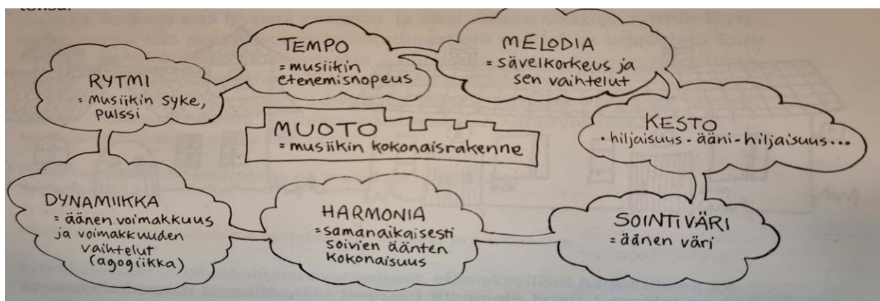
Kuva 1. Musiikin osatekijät toimivat vuorovaikutuksessa toistensa kanssa. (Hongisto-Åberg, 1997).

Hongisto-Åberg ym. (1994, s. 23) kertoo musiikin muodostuvan rytmistä, temposta, melodiasta, kestosta, sointiväristä, harmoniasta ja dynamiikasta. Nämä kaikki yhdessä muodostavat musiikin kokonaisrakenteen ja näin ollen nämä osatekijät toimivat vuorovaikutuksessa keskenään (Kuva 1). Rytmistä voidaan ajatella musiikin selkärankana. Se tukee kappaletta, mutta se voi myös vaihtua tai pysyä koko ajan samana. Tempo puolestaan tarkoittaa nopeutta, eli millä nopeudella musiikki etenee kappaleessa. Melodian kautta musiikille rakentuu sävelkorkeus ja niiden vaihtelut. Melodia voi olla kirkasta ja kauniin kuuloista, tai se voi olla riitasointuista ja omalla tavallaan särisevää kuuntelijalle. Kesto puolestaan määrittelee miten kauan musiikkia kuuluu kappaleessa. Yhtä tärkeää on hiljaisuus ja tauot, jotka voidaan musiikissa määritellä äänettömänä kohtana (Hongisto-Åberg, ym. 1994, s. 23).