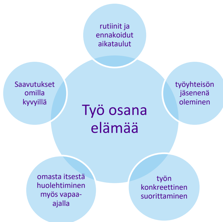
KUVIO 1. Käsitykset työelämästä.

Erityistä tukea tarvitsevat ammattiin opiskelevat nuoret käsittävät työelämän ja tulevaisuuden moninaisesti. Tutkimuskysymyksen vastauksista on koottu pääteemat kuvioon 1, jossa näkyy miten työelämä ja vapaa-aika liittyvät toisiinsa, miten arjen toivotaan rakentuvan ja mitä työ tekijältään vaatii.