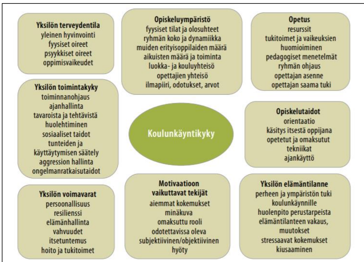
Kuvio 1. Koulukuntoisuuteen / koulunkäyntikykyyn yhteydessä olevat tekijät (Puustjärvi 2017, 39)

Oppilaan koulukuntoisuuden arviointi tulee ajankohtaiseksi, jos oppilas ei suoriudu opiskelusta tuesta huolimatta, kieltäytyy käymästä koulua tai jos hänen oireistaan tai käytökseltään on haittaa hänelle itselleen tai muille. Koulukuntoisuutta arvioitaessa on otettava huomioon sairauden tai diagnoosin lisäksi myös toimintaympäristö ja oireiden tilannesidonnaisuus. (Puustjärvi & Luoma 2019, 116.) Arvio on tehtävä huolellisen tilannekartoituksen pohjalta ja siihen tarvitaan tiivistä moniammatillista yhteistyötä sosiaali- ja terveydenhuollon ja opetustoimen kesken. Arvioinnin kohteina ovat oppilaan käyttäytymisen taustalla olevat syyt, koulun ja ryhmän tilanne sekä eri tahojen järjestämä tuki (taulukko 1). (Puustjärvi 2017, 40.)