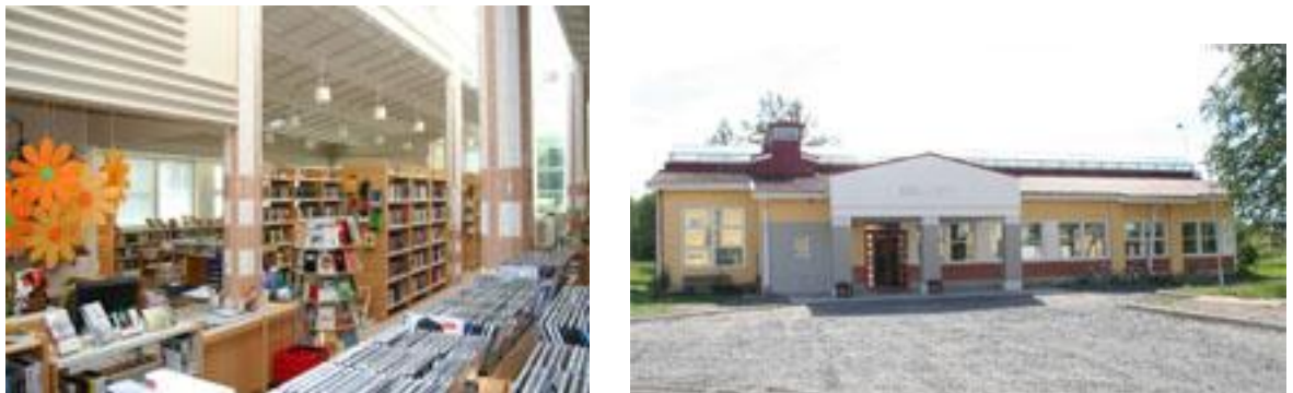
Kuvio 1. Merijärven kirjasto sisältä ja ulkoa