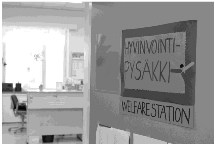
KUVA 2 Näkymä Hyvinvointipysäkiltä (Gullstén, 2012)

Hyvinvointipysäkin harjoittelu kestää neljä viikkoa. Jakson aikana opiskelijoilta edellytetään omatoimisuutta, aktiivista ja itsenäistä otetta työhön ja itsensä kehittämiseen. Hyvinvointipysäkillä opiskelijat oppivat ottamaan erilaisia verikokeita ja myös analysoimaan ja tulkitsemaan tavallisimpia laboratorionäytteitä ja testejä. Kädentaidot pääsevät näin kehittymään jakson aikana. Tietoa ja taitoa opiskelijoille kehittyy myös erilaisten kotikäyntien, tapahtumien sekä ryhmätoimintojen suhteen. (Terveyspysäkin 10-vuotisjuhlapuheenvuoro 2006, Arja Meinilä.)