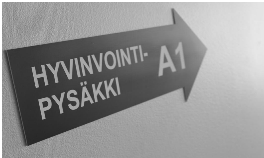
KUVA 1 Hyvinvointipysäkille ohjaava kyltti (Gullstén, 2012)

Hyvinvointipysäkki on perustettu vuonna 1996. Hyvinvointipysäkki on toiminut nimellä Terveyspysäkki kevääseen 2012 asti. Hyvinvointipysäkki sijaitsee Kemi-Tornion ammattikorkeakoulun terveystalon toimipisteessä (KUVA 1 & 2). Hyvinvointipysäkin lähtökohtana on terveyden ja hyvinvoinnin edistäminen sekä asiakaslähtöisyys ja moniammatillisuus. Hyvinvointipysäkki tarjoaa asiakkailleen erilaisia palveluja opiskelijatyönä. Näitä palveluita ovat terveystarkastukset, laboratorionäytteiden otot ja niiden analysointi sekä koti- ja asiointiaivot. Hyvinvointipysäkki on laadukas harjoittelupaikka sairaanhoitaja-, terveydenhoitaja-, geronomi- ja sosionomiopiskelijoille. Opiskelijat tekevät harjoitteluja Hyvinvointipysäkillä ja siellä heille järjestetään jakson tavoitteiden mukaisia työtehtäviä. (Kemi-Tornion Ammattikorkeakoulu 2011; Hannele Paloranta haastattelu 6.10.2011.)