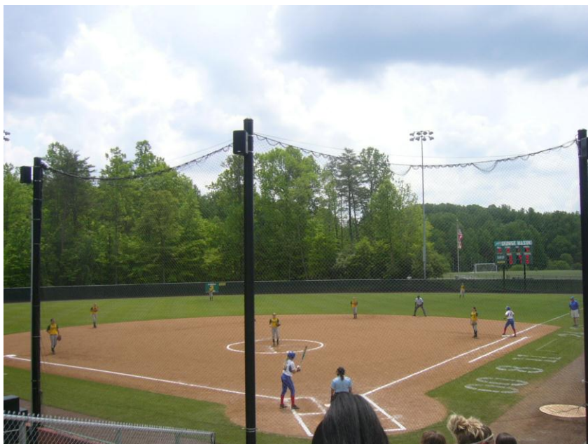
KUVIO 3. Kauden viimeinen softball – peli.

Baseball ja softball otteluissa katsomossa oli paljon pelaajien omaisia, koska kyseessä oli myös kauden viimeinen kotipeli ja tätä myöten viimeisen vuoden opiskelijoiden viimeinen peli kotiyliopistolla.