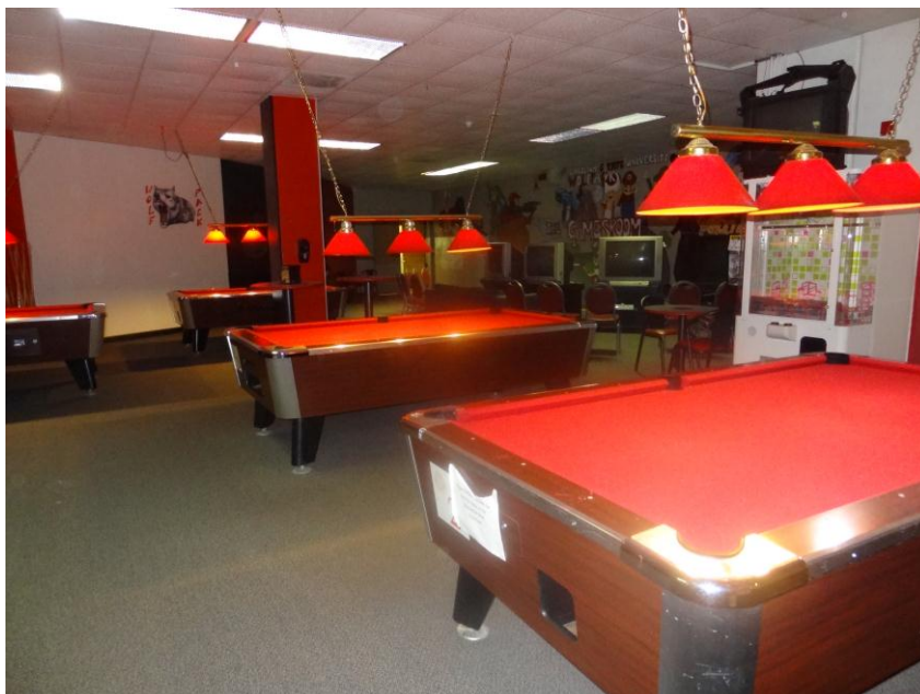
KUVIO 6. North Carolina State University.

värimaailma mukailevat koulun maskottia ja joukkueiden värejä. Jopa tuolien selkämyksiin on leikattu suden kuva. North Carolina State Universityn urheilujoukkueet tunnetaan nimellä ”Wolf pack”. Myös väriteema myötäilee koulun värejä.