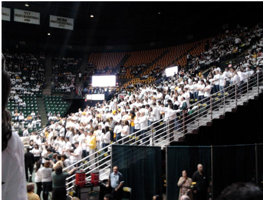
KUVIO 2. Opiskelijakatsomo.