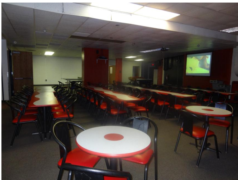
KUVIO 7. North Carolina State University