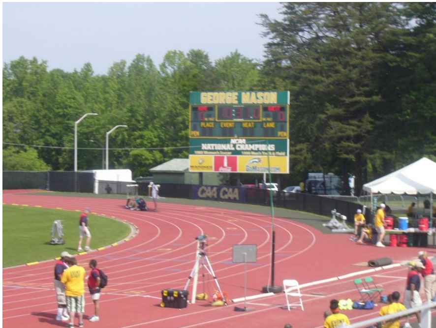
KUVIO 5. George Mason University:n yleisurheilukenttä. Track and field NCAA championships.

Kampuksella on iso noin 10 000 henkeä vetävä areena, jossa pelataan miesten ja naisten koripallo ottelut. Kampuksella sijaitsee myös yleisurheilukenttä, pesäpallo- ja softball kentät, jalkapallo kenttä, lentopallo kenttä sekä uimahalli.