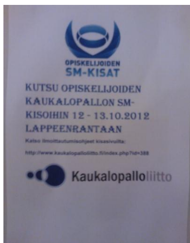
KUVIO 1. Opiskelijoiden kaukalopallon SM-kisojen ilmoitus.

Opiskelijoiden SM-kisat eivät juuri näy kampuksilla. Mainokset on kiinnitetty liikuntapaikkojen läheisyyteen, mutta jos opiskelija ei harrasta kyseistä lajia, mainosta ei välttämättä edes huomaa.