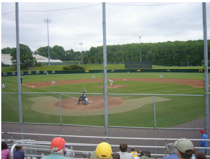
KUVIO 4. Kauden viimeinen baseball kotipeli.