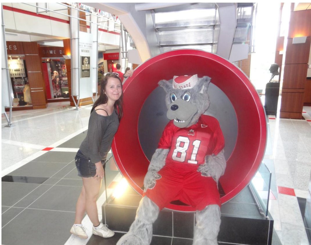
KUVIO 9. Jalkapallo museo.

Jalkapallostadionin sisäänkäynnissä on museo, jossa ovi tutustua joukkueen historiaan ja saavutuksiin. Myös amerikkalaisen jalkapallon joukkueen oma kuntosali sijaitsee tässä rakennuksessa. Tässä kuvassa on koulun maskotti Mr. Wuf.