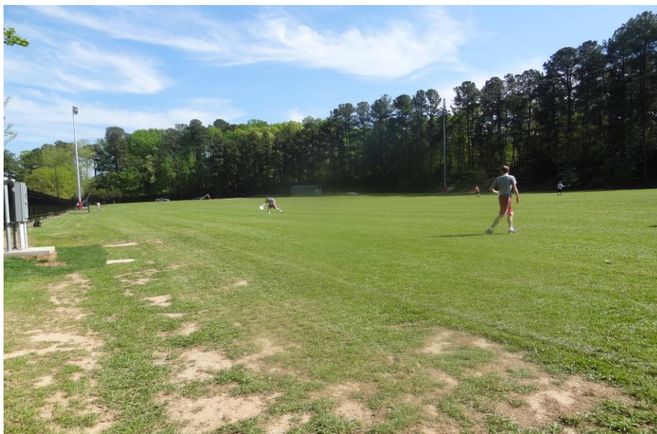
KUVIO 11. Viherkenttä

Yliopiston uimahallissa vallitsee myös koulun värit. Allas sijaitsee Yliopisto kampuksella.