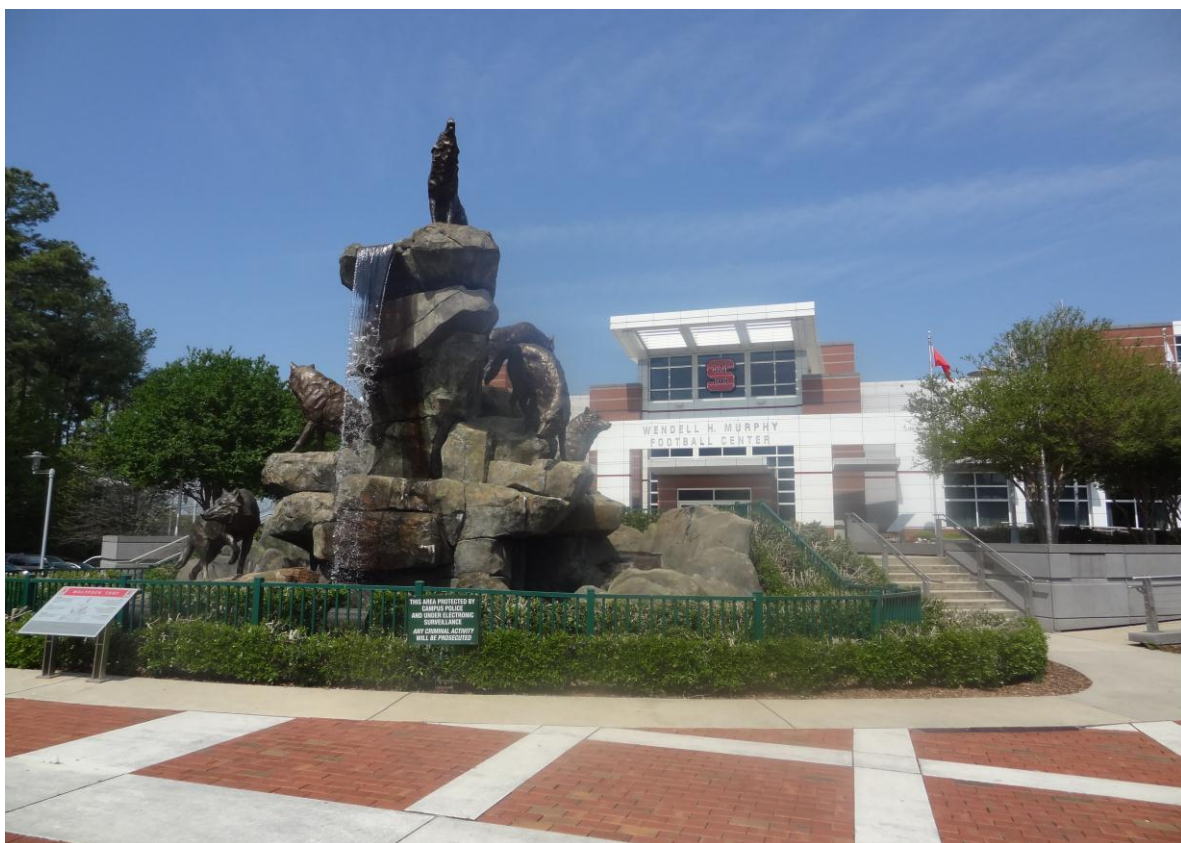
KUVIO 8. North Carolina State University amerikkalaisen jalkapallon areena.

Suihkulähde areenan edustalla mukailee joukkueen teemaa. Punaisissa kivetyksissä on lahjoittajien nimiä, kuten yrityksiä, alumneja ja vanhempia.