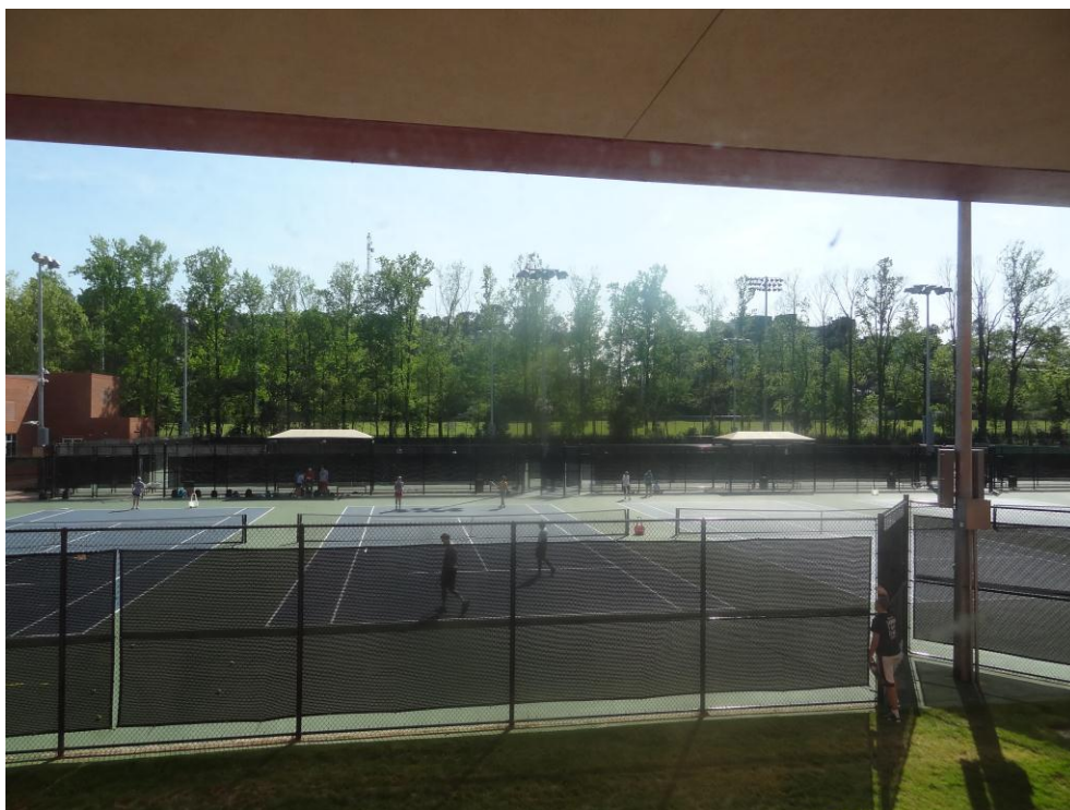
KUVIO 12. Tenniskentät.

Kampukselta löytyy muun muassa 18 tenniskenttää.