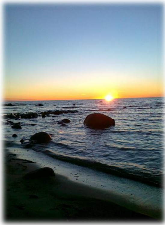
KUVIO 5. Auringonlasku Hailuodon Marjaniemessä. (Jylänki 2011.)

Hailuodon Marjaniemen entisen luotsi- ja majakka-aseman rakennushistoriallisen selvityksen (2008) mukaan on koko Hailuoto arvokasta maisema-aluetta sekä maakunnallisesti että valtakunnallisesti. Marjaniemen majakka, vanha luotsiasema ja majakkahenkilökunnan rakennukset ovat kulttuurihistoriallisesti merkittäviä kohteita maakunnallisesti ja valtakunnallisesti. Rakennushistoriallisen selvityksen mukaan Marjaniemen alue on merkitty Pohjois-Pohjanmaan maakuntakaavassa (25.8.2006) valtakunnallisesti tärkeänä ja vaalittavana kulttuurihistoria- ja matkailupalvelujen alueena. (Jylkkä-Karppinen ym. 2008, 3.)