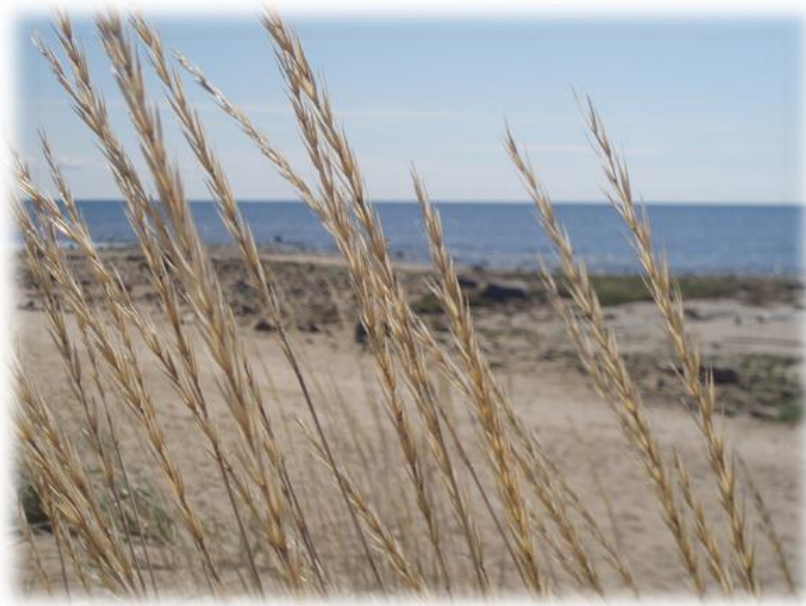
KUVIO 4. Hailuodon rantakasvillisuutta. (Jylänki 2012.)

Hailuodon saaristolaisilme ja sille ominaiset piirteet ovat säilyneet, vaikka Hailuoto sijaitsee vain 50 kilometrin päässä Oulusta. Hailuodon monimuotoinen arvokas luonto ja sen kansallismaisema soveltuu sekä päivä- että pitempi aikaiseenkin retkeilyyn. Luontokohteisiin on rakennettu lintutorniverkosto ja sitä tukevia rakenteita. Hailuodon luonto pitää sisällään monipuolisen kokoelman edustavia ja toisistaan erottuvia luontotyyppisiä. (Pessa 2004, 204.)