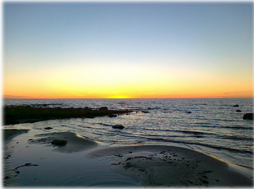
KUVIO 2. Luonto voi toimia yhtenä alueen vetovoimatekijöistä. (Jylänki 2011.)

liioihin, ohjelmapalvelut, harrastusmahdollisuudet ja tapahtumat. Matkailutuote muodostuu kokonaisuudesta, jonka muodostavat attraktiot, vetovoimatekijät ja mielikuvat yhdessä matkailupalvelujen kanssa. Ne yhdessä tekevät kohteesta houkuttelevan ja näkemisen arvoisen. (Järviluoma 1994; Albanese & Boedeker 2002, 24.)