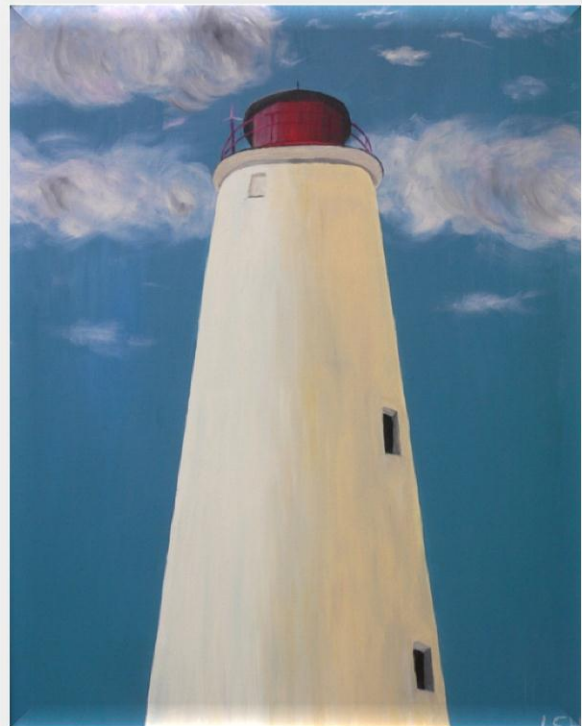
Öljvärimaalaus Marjaniemen majakasta, Lena Segler-Heikkilä 2010.

Proomu oli ns. Porttiviitta-alus, josta käytettiin kansan suussa nimitystä Porttiprikka. Keskiniemi ja Hiidenniemi saivat valtion rakennuttamina puiset tunnusmajakat. Hailuodossa Marjaniemen edustalla ollut miehittämätön porttiviitta-alus oli Suomen majakkalaivojen edeltäjä. Aluksessa ei ollut pysyvää valaistusta, mutta se näytti luotsinkohtauspaikan massiivisena kauas asti ja lisäksi sen asennosta