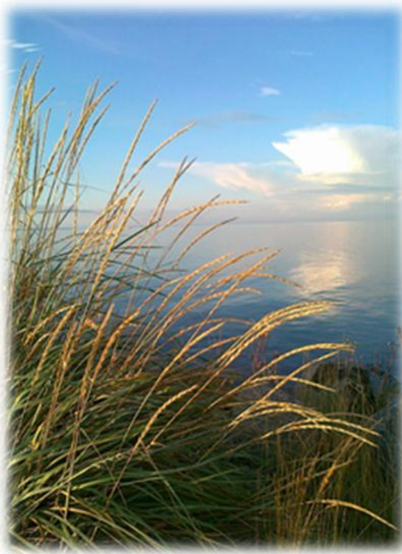
KUVIO 1. Kuvituksella luodaan tekstiin tietynlaista tunnelmaa. Kuva Siikajoelta, horisontissa siintää Hailuoto. (Jylänki 2011.)

Kuvitusta käyttämällä voidaan saada viestiin tietynlainen tunnelma. Valitsemalla tekstiin tyyliin sopivat kuvat, tulee kokonaisuudesta tasapainoinen. Vakaviin aiheisiin valitaan vakavat kuvat ja iloisiin aiheisiin iloiset kuvat. Kuvan tarkoituksena on olla tukemassa viestin kokonaisvaikutelmaa. Jos kuvan ja tekstin välillä on ristiriitaa aiheuttaa se epäselvyyttä ja hämmennystä viestin tarkoituksesta. (Söderlund 2005, 273.)