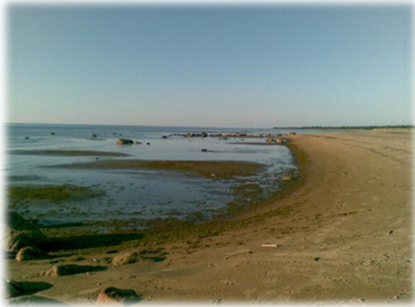
KUVIO 3. Hailuodon rantaviivaa. (Jylänki 2011.)

Liitteenä olevassa majoittujan käsikirjassa on matkailupalvelun kokonaistuotenäkökulma huomioitu siten, että mukaan on otettu palveluita joita kohteeseen saapunut majoittuja mahdollisesti tarvitsee. Esimerkkinä näistä palveluista ovat muun muassa ravintola- ja kahvilapalvelut, liikennepalvelut sekä ohjelma- ja kulttuuripalvelut. Majoituspalveluja käyttävä asiakas tarvitsee yleensä enemmän palveluita, kuin pelkkä päiväkävijä.