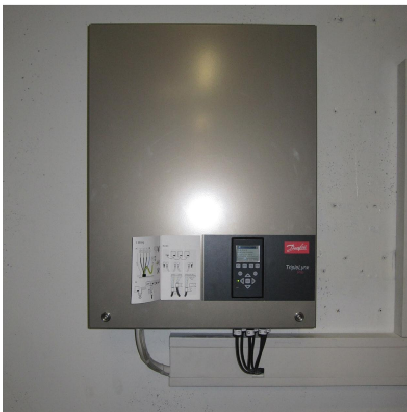
Kuva 4. Vaihtosuuntaaja Danfoss TLX PRO