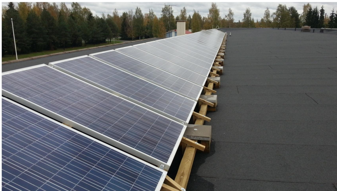
Kuva 5. Paneelit asennettuna