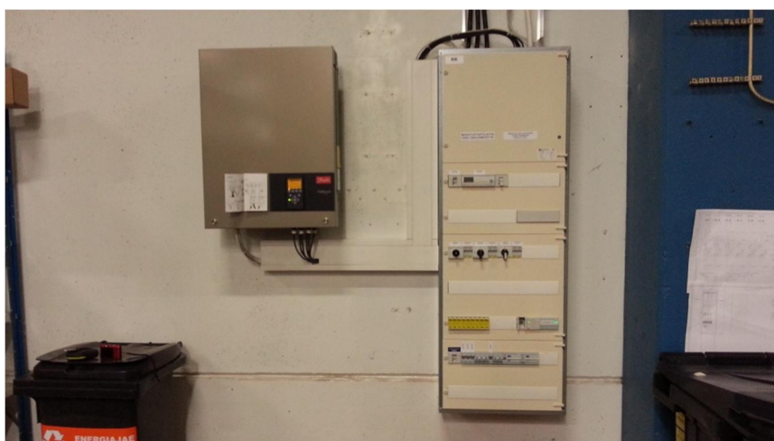
Kuva 7. Ryhmäkeskus ja vaihtosuuntaaja asennettuina

Ryhmäkeskukselta paneeleilla menevä kaapelointi piti viedä ylös seinää pitkin katolle sekä läpi betoniseinän. Tasajännite käyttöön sopivat solar kaapelit eivät olisi