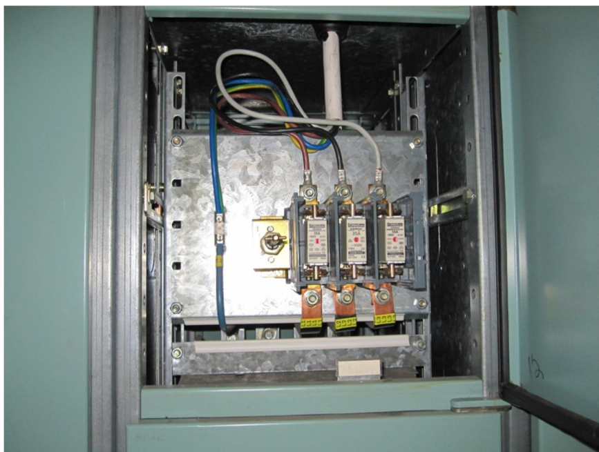
Kuva 6. Pääkeskuksen syöttö kytkettynä

Tarkoituksena oli asentaa vaihtosuuntaaja ja ryhmäkeskus näkyville, joten näiden paikka oli luonnollisesti sisällä tehtaassa. Aurinkosähköjärjestelmän standardit vaativat ylijännitesuojat ja niiden asennuksen mahdollisimman lähelle paneeleja. Ryhmäkeskukselle ja vaihtosuuntaajalle valittiin tällä ehdolla paikka, josta päästiin lyhyintä reittiä paneeleille.