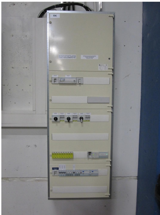
Kuva 2. Ryhmäkeskus asennettuna

Keskukseen asennettiin lisäksi suora-energiamittari, jossa on väyläliitäntä tietojen lähettämistä varten sekä varattuna tilat ja riviliittimet tulevaisuudessa tapahtuvalle aurinkoenergiajärjestelmän laajentamiselle, noin 30kW suuruiseksi. Standardin ST 55.33 (2009) mukaan keskus varustettiin tasajännitepuolen sekä vaihtojännitepuolen erotuslaitteilla ja varoitusteksteillä mahdollisesta takajännitteestä.