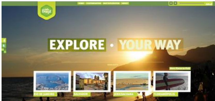
KUVIO 4. IntoBrazilin etusivu. (IntoBrazil.net, hakupäivä 5.10.2012.)

Flashin ensimmäinen versio julkaistiin Macromedian toimesta vuonna 1996, mutta samankaltaisia työkaluja oli ollut jo parisen vuotta. Nykyään ollaan versiossa 11 ja kehittäjänä on Adobe, joka osti Macromedian vuonna 2005. (Adobe, hakupäivä 27.4.2012.)