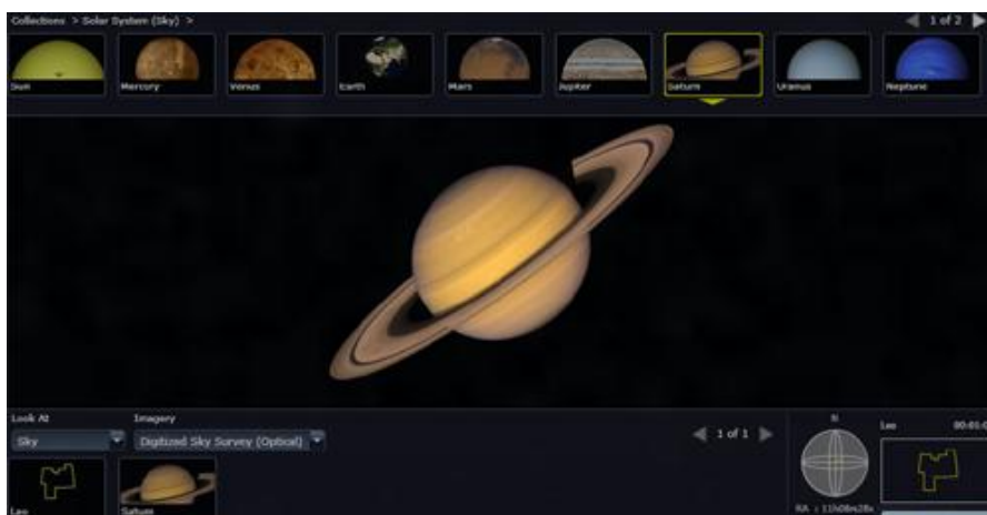
KUVIO 5. World Wide Telescopen näkymä. (Worldwidetelescope.org, hakupäivä 11.9.2012.)

Microsoftin alaisten sivujen (esimerkiksi xbox.com) lisäksi Silverlightia käyttää jokunen iso internet-sivusto. Suomalaisittain merkittäviä ovat esimerkiksi MTV3:n Katsomo-palvelu ja elokuvia ja sarjoja esittävä Viaplay. Viaplayn tapainen USA:ssa merkittävä ja hiljattain Suomessa lanseerattu Netflix käyttää myös Silverlightia. Yksi mielenkiintoisimmista Silverlightilla toteutuista web-sovelluksista on World Wide Telescope (kuvio 5), jolla voi tutustua tähtiin ja planeettoihin. Silverlight ei kuitenkaan missään nimessä ole suosittu kehitysympäristö, sillä vain noin 0,2 % kaikista internetsivuista käyttää sitä (Silverlight Usage Statistics, hakupäivä 11.9.2012).