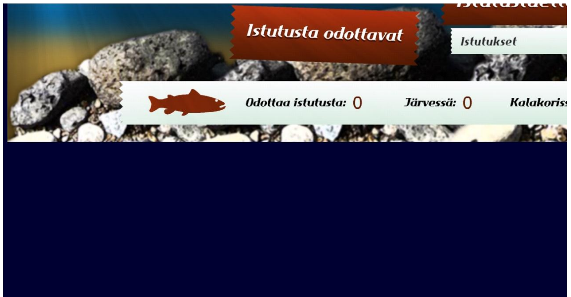
KUVIO 7. Virtuaalijärven näkymä mobiililaitteessa.

Jos Virtuaalijärvi on jatkossakin Flash-pohjainen, oman mobiilisovelluksen kehittäminen voi olla tarpeellista lähitulevaisuudessa. Tarpeellisuus riippuu kuitenkin ensisijaisesti kohderyhmästä. Jos kohderyhmä on sellainen, joka ei käytä mobiilisovelluksia, niin mobiilikäytöstä ei tarvitse välittää. Älypuhelimien käytön kasvaessa voidaan kuitenkin tulla tilanteeseen, jossa suurin osa käyttää mobiilisovelluksia paljonkin. HTML5 voi olla ratkaisu, koska sillä voidaan kehittää sovellus, joka toimii hyvin niin työpöytäympäristössä kuin mobiililaitteessa. Silloin myös vältetään tilanne, jossa tarvitsee ylläpitää montaa eri sovellusta eri laitteille.