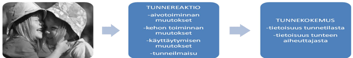
Kuvio 5. TIETOISET JA TIEDOSTAMATTOMAT TUNNEREAKTIOT. ( ks. alkuperäinen kuva Nummenmaa 2010, 16)

Nummenmaa (2010, 16) havainnollistaa normaalisti ulkoisista tapahtumista aiheutuvia automaattisia tunnereaktioita. Kuviossa 4 on kuvattu tunteen aiheuttavaa tapahtumaa josta seuraavat tiedostamattomat ja automaattiset tunneprosessit, tunnereaktiot sekä tietoista osaa tunneprosessissa, tunnekokemusta. Syystä tai toisesta johtuva tunteiden nimeämisen ja tunnistamisen vaikeuden voidaan näin ollen ajatella johtavan niin sanottuihin vääriin tulkintoihin sekä reagointiin.