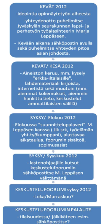
Kuvio 6. KESKUSTELUFOORUMIN ALUSTAVA SUUNNITELMA

Keskustelufoorumin toteutuksen alustava suunnitelma on kuvattu yksinkertaistettuna seuraavassa prosessikaaviossa: