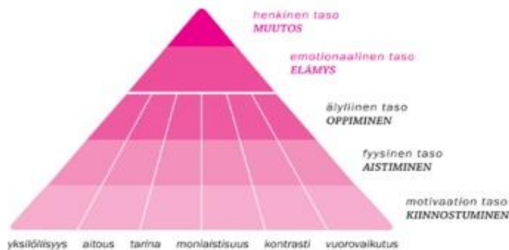
Kuva 3 Elämyksen muodostaminen elämystuotteiden avulla (Lapin elämysteollisuuden osaamiskeskus 2009)

Elämys on kokolaiilla henkilökohtainen prosessi, koska ihminen itse tietää, mikä hänestä on elämyksellistä. Tällä viitataan siihen, ettei suunniteltu elämys ole aina välttämättä saavutettu elämys, koska ihmiset mieltävät asiat eri tavoilla. On kuitenkin mahdollista tuottaa elämykselliset ja kokemukselliset puitteet, joissa on suurempi todennäköisyys kokea elämys. (Lapin elämysteollisuuden osaamiskeskus 2009.) Elämystuotteet, kuten vaikka talvinen reki ajelu tai saarella tapahtuva tasting-tilaisuus, ovat esimerkkejä ympäristöstä, joista elämyksen saaminen on suunnitellusti mahdollista.