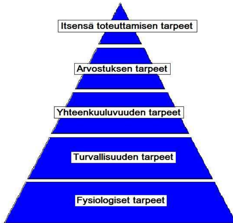
Kuvio 1. Maslow'n tarvehierarkia

itsearvostuksen ja itsensä toteuttamisen tarpeet ovat yhdistettävissä yhteisöllisyyteen ja sosiaaliseen kanssakäymiseen. Teorian pohjalta voidaan ajatella, että ilman yhteisöihin kuulumisen tunnetta ihmisen on vaikea kokea itsearvostusta, tai toteuttaa ja kehittää itseään.