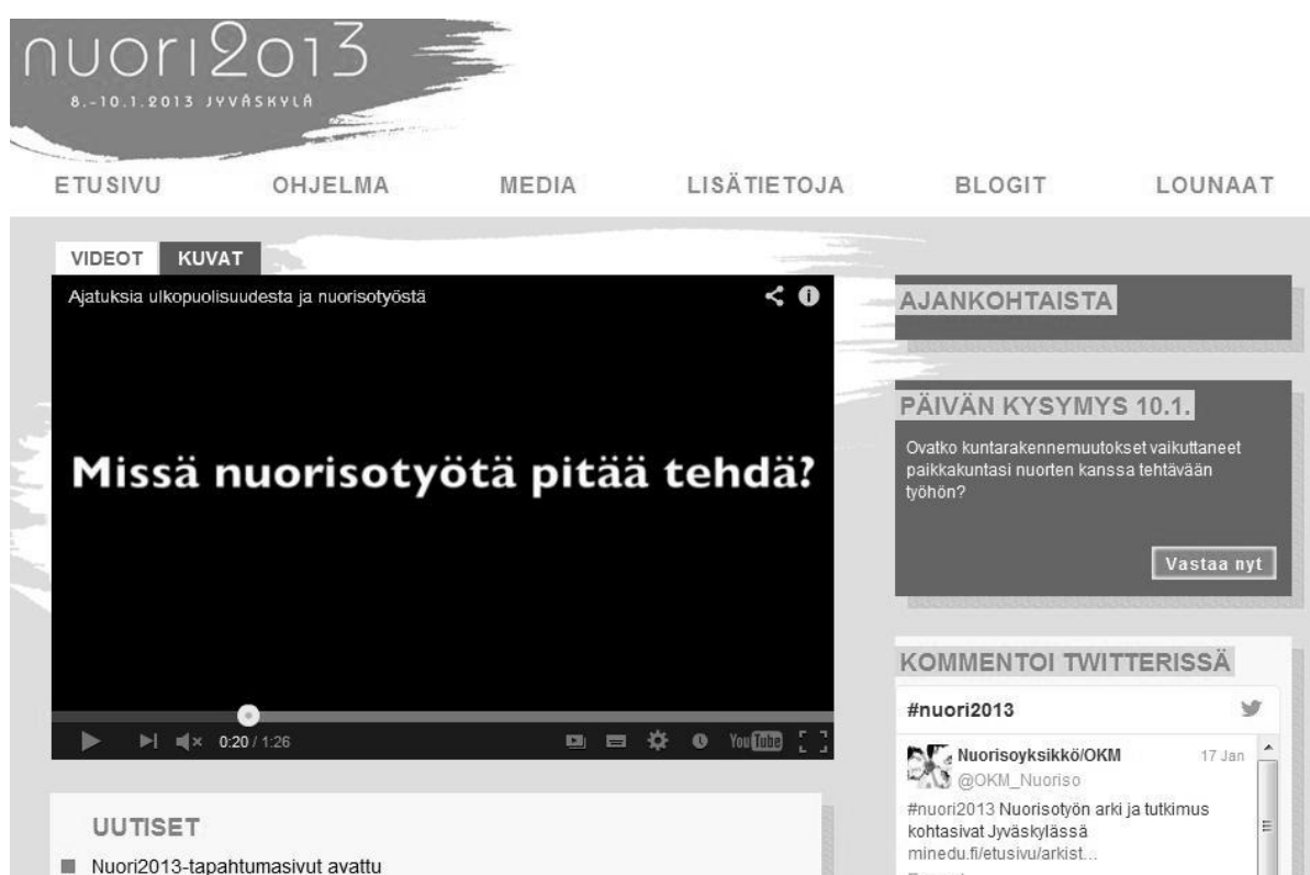
Kuva 1: NUORI2013-tapahtumaa markkinoitiin aktiivisesti myös tapahtuman www-sivuilla, josta yllä kuvakaappaus.

taiseen viestintään. Facebookista löytyvät myös Allianssi ry:n, Nuorisotutkimusseuran sekä Työpajayhdistyksen omat sivut ja näiden lisäksi myös Suomen ev. lut. kirkolla on Kirkko Suomessa –sivusto. On harvoja järjestöjä, yrityksiä ja yhdistyksiä, jotka eivät löydy jollain tapaa verkosta. Medianäkyvyyteen oli panostettu jo ennen tapahtumaa, esimerkiksi mainonnalla lehdissä ja www-sivuilla. Tapahtumalle oli kehitetty omat sivut Twitter- ja Facebook-yhteisöpalveluissa. Nämä yhteisöpalvelut antoivat osallistujien, näytteilleasettajien sekä työntekijöiden kommentoida reaaliaikaisesti tapahtumaa ja siellä esille nousseita teemoja. Keskustelu pysyi aktiivisena läpi koko tapahtuman ja vielä sen jälkeenkin.