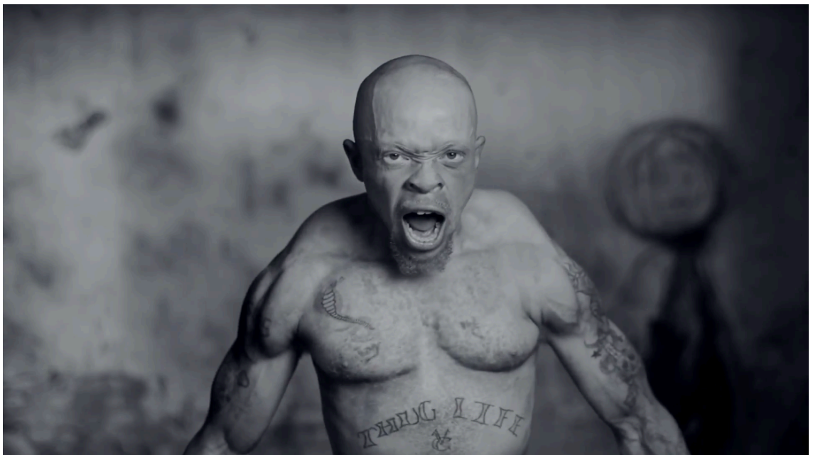
Kuva 13. Uhkaava mies (Die Antwoord – I Fink U Freeky 2012)