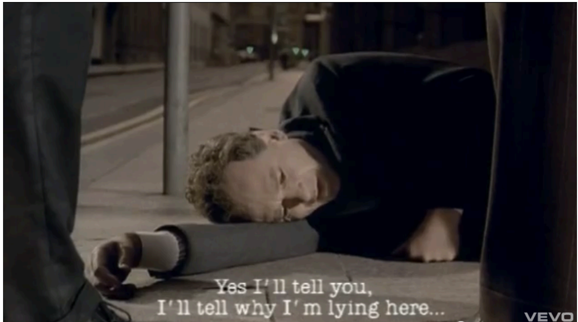
Kuva 6. Syyn paljastaa aikova mies (Radiohead – Just, 1995)