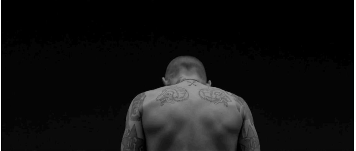
Kuva 14. Symmetristä minimaalista kerrontaa (Woodkid – Iron, 2011)