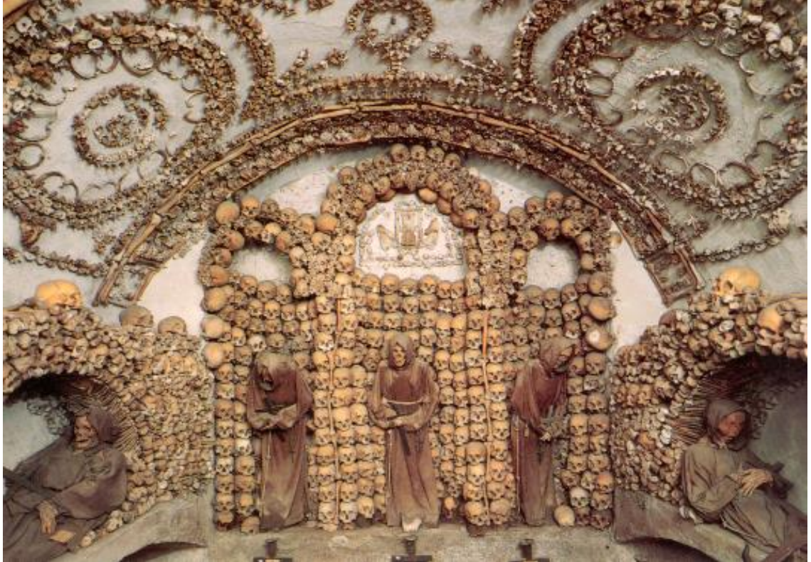
Kuva 1. Munkkien kalloista tehty alttari (Crypt of the Skulls)