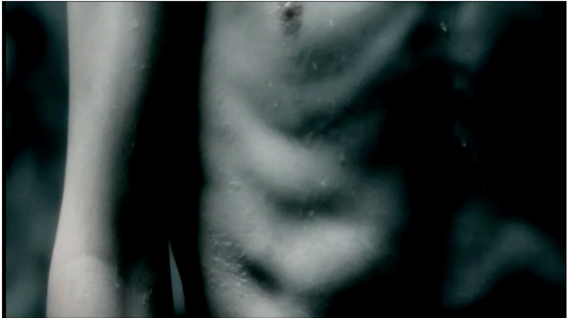
Kuva 3. Lähikuvia Daddyn vartalosta (Aphex Twin – Come to Daddy)

Videon alussa örkki eli primitiivinen puoli alkaa heräilemään valojen, eli huomion, eli itsetutkiskelun osuttua siihen. (Kuva 4) Heräämiskuvassa örkki on alasti lattialla ikään kuin sikiöasennossa. Kuvaa keksiessä tuo tuntui hyvin luonnolliselta ratkaisulta. Oikeastaan se oli itsestään selvää ja mitään muuta vaihtoehtoa ei edes tullut mieleen.