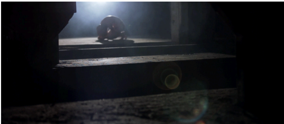
Kuva 4. Valoon heräävä Örkki (Skirmish - The Mirror Distortion 2013)

Videon alussa örkki eli primitiivinen puoli alkaa heräilemään valojen, eli huomion, eli itsetutkiskelun osuttua siihen. (Kuva 4) Heräämiskuvassa örkki on alasti lattialla ikään kuin sikiöasennossa. Kuvaa keksiessä tuo tuntui hyvin luonnolliselta ratkaisulta. Oikeastaan se oli itsestään selvää ja mitään muuta vaihtoehtoa ei edes tullut mieleen.