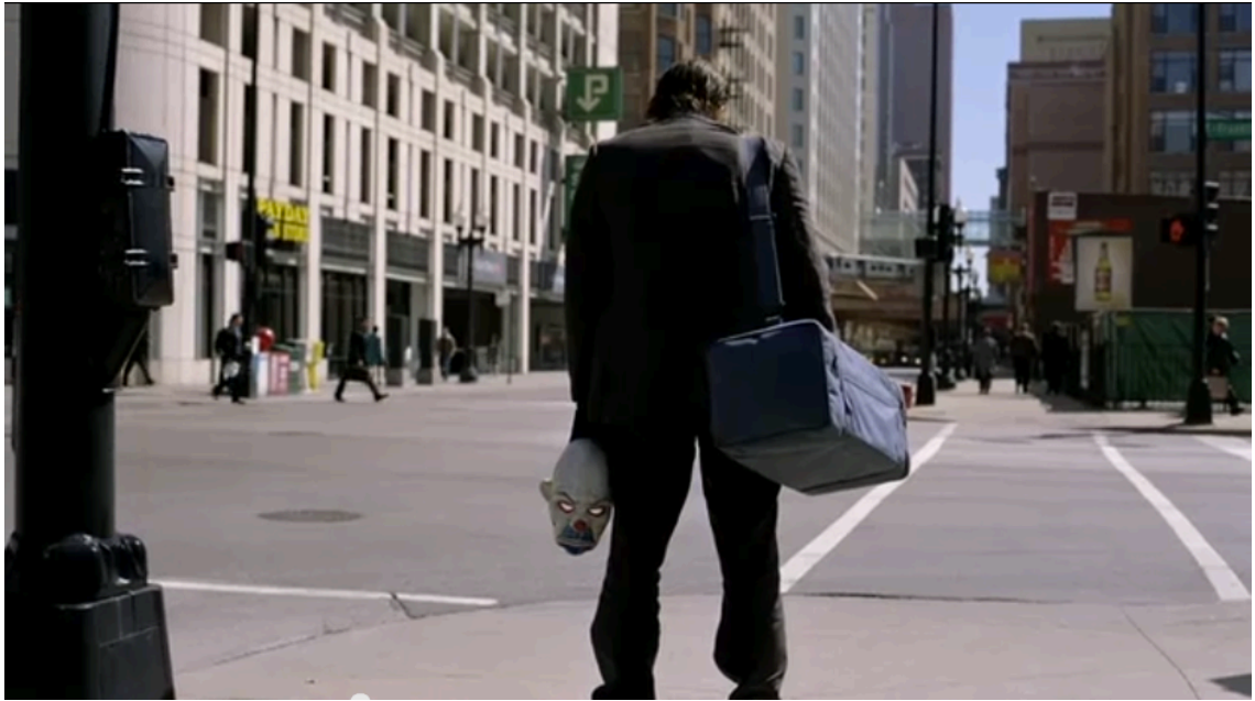
Kuva 10. Kohtalokas Jokeri (The Dark Knight, 2008)