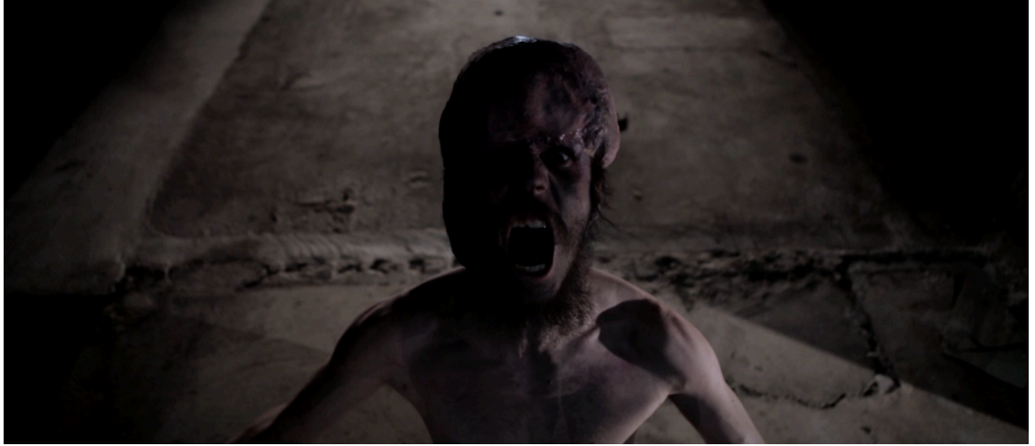
Kuva 12. Herätetty Johnny Orc (Skirmish - The Mirror distortion, 2013)

eri kohdassa. Katsojan herättäessä örkkiä, ja myöhemmin tämän tullessa yhdeksi katsojan kanssa. Örkki eli primitiivinen puoli siis uneksi valtaan pääsystä. Ja pääseekin.