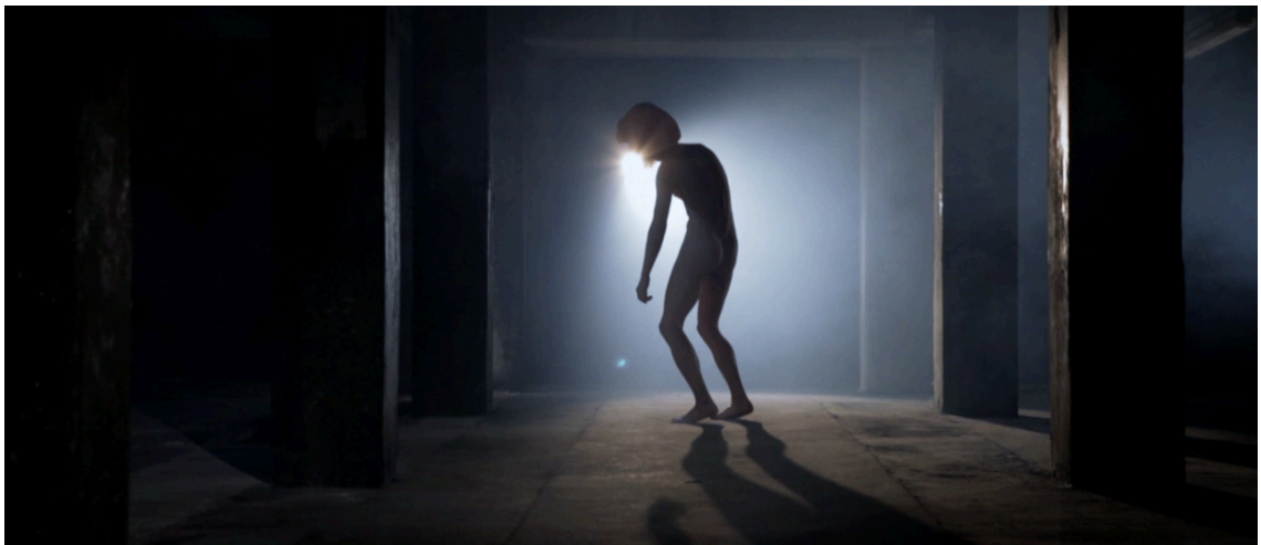
Kuva 11. Kohtalokas Johnny Orc (Skirmish – The Mirror Distortion, 2013)

Örkin luone on hieman epävakaa. Hänestä tarvitsi katsojan naamalle tulevia raivoamiskuvia ennen, loppupuoliskolla ilmenevää leppoisaa puolta tehdäkseen tästä paljastuksesta yllätyksellisemmän (kuva 12). Referenssinä käytin Roger Ballenin Die Antwoordille ohjaamaan I Fink U Freeky musiikkivideon yhtä kuvaa, jossa etäisesti örkkiämme muistuttava hahmo huutaa kohti kameraa (kuva 13). Referenssikuvan hahmo on uhkaavampi, mutta meidän omastamme tuli informatiivisempi ja elokuvallisempi pienellä lintu-perspektiivillään. Kompositio on melko samanlainen, mutta siihen vaikutti enemmänkin Woodkid yhtyeen musiikkivideoiden kuvallinen kerrontatyyli, jonka on symmetrisiä, kaksiulotteisia ja tyyliä kuvaa (Kuva 14). Samaa örkin huutokuvaa käytin kahdessa