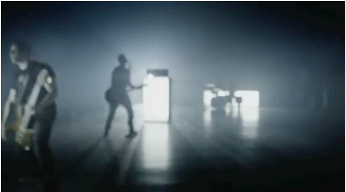
Kuva 8. Yhtyettä panoroiva takavallo. (Sunrise Avenue – Hollywood Hills, 2011)