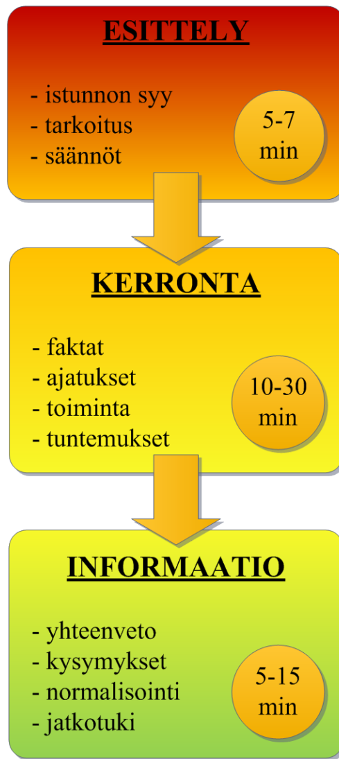
KUVIO 2. Istunnon vaiheet (Mitchell & Everly 2001, 129-132).