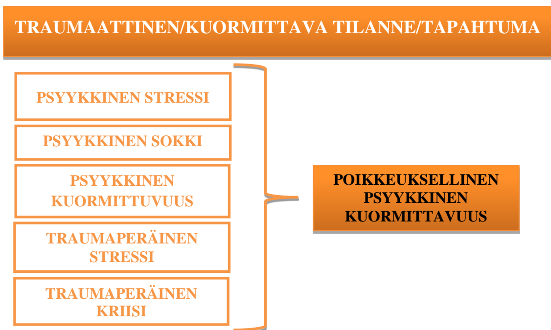
KUVIO 3. Poikkeuksellinen psyykkinen kuormittavuus

Tässä työssä poikkeuksellisella psyykkisellä kuormittavuudella tarkoitetaan ennalta odottamattomien, suunnittelemattomien tai yllättävien, erityisen kuormittavien tilanteiden aiheuttamia mahdollisia psyykkisiä reaktioita. Käsitteen ulkopuolelle on rajattu säännöllinen työhön kuuluvien tavallisten tilanteiden ja hoitosuhteiden mahdollisesti aiheuttama pidempiaikainen kuormitus sekä ihmisen elämään kuuluvat kehitykselliset kriisit. (Heponiemi ym. 2009, 12; Nieminen, 2007, 6.) Koska psyykkisiä reaktioita ja niiden jälkiseuraamuksia on hyvin erilaisia, emme suoraan voi käyttää jo olemassa olevia termejä, kuten psyykkinen stressi, psyykkinen sokki tai psyykkinen kuormittavuus. Ihmiset kokevat kuormittavat tilanteet hyvin eri tavoin, myös kirjallisuudessa asiasta käytetään erilaisia nimityksiä (Nieminen 2007, 4-5). Koska kaikki edellä mainitut termit liittyvät työmme teoreettiseen viitekehykseen, selvitimme monipuolisesti tärkeimmissä lähteissämme esiintyviä termejä ja muokkasimme niiden avulla työhömmme parhaiten soveltuvan käsitteen (kuvio 3).