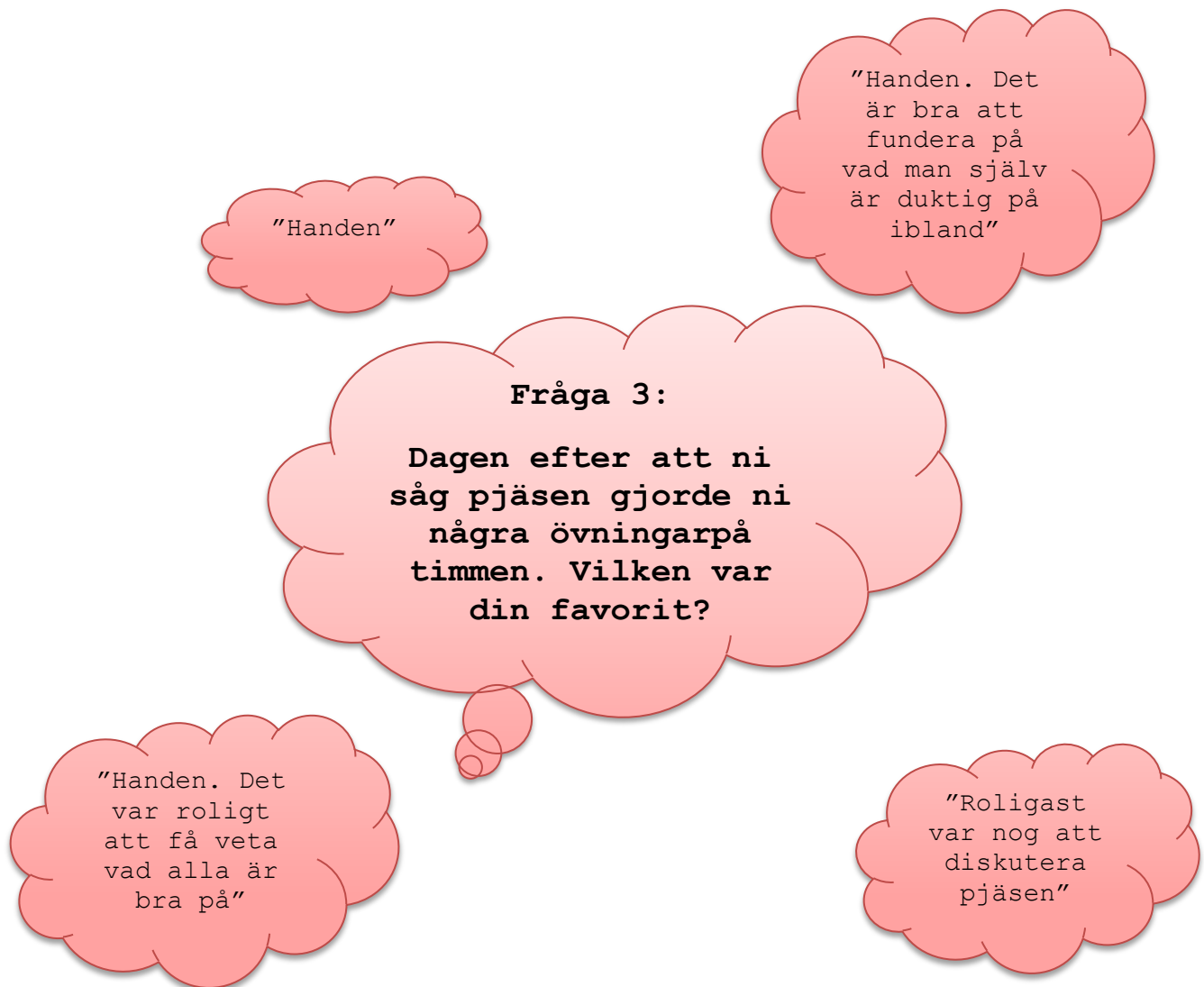
Figur 9. Enkät för elever, fråga 3.