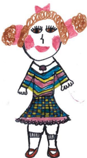
Figur 4. Varja. Illustrerad av Nadja Häggblom, 2012.

Katten är hennes enda vän på mammas gård. Den berättar sagor för Varja. Om rönnbäret som åkte upp till himlen för att tala Lille Gud tillrätta och om pojken som höll andan för att leva längre än alla andra.