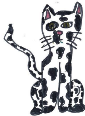
Figur 3. Katten. Illustrerad av Nadja Häggblom, 2012

Varja står på gården och tänker efter. Hon tänker på sin granne som hon kallar för Himmel och Pannkaka. Himmel och Pannkaka har förts till sjukhus och Varja är rädd för att hon skall dö. Hur skall Varja kunna be om ursäkt för att ha rotat i Himmel och Pannkakas rabatter om hon dör?