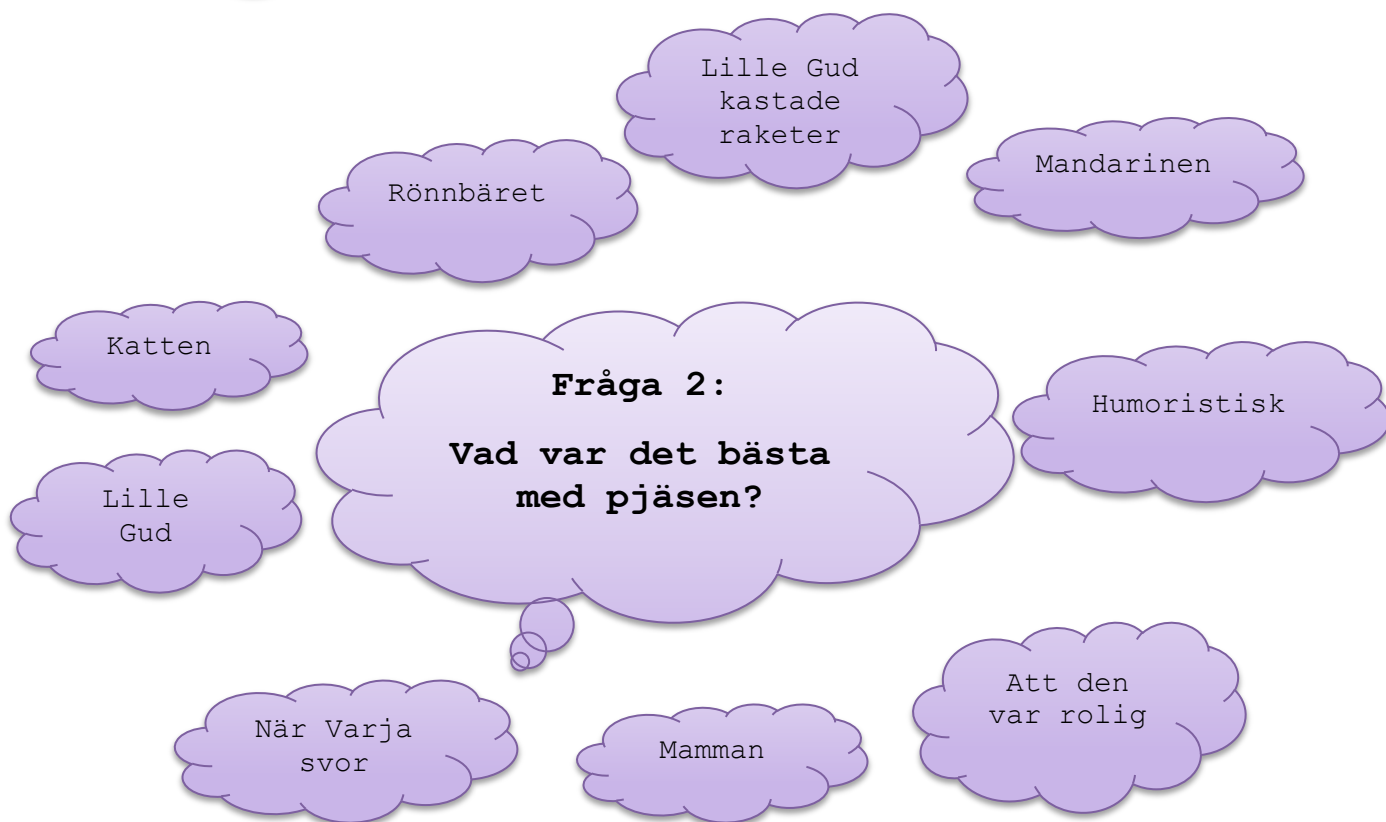
Figur 8. Enkät för elever, fråga 2.