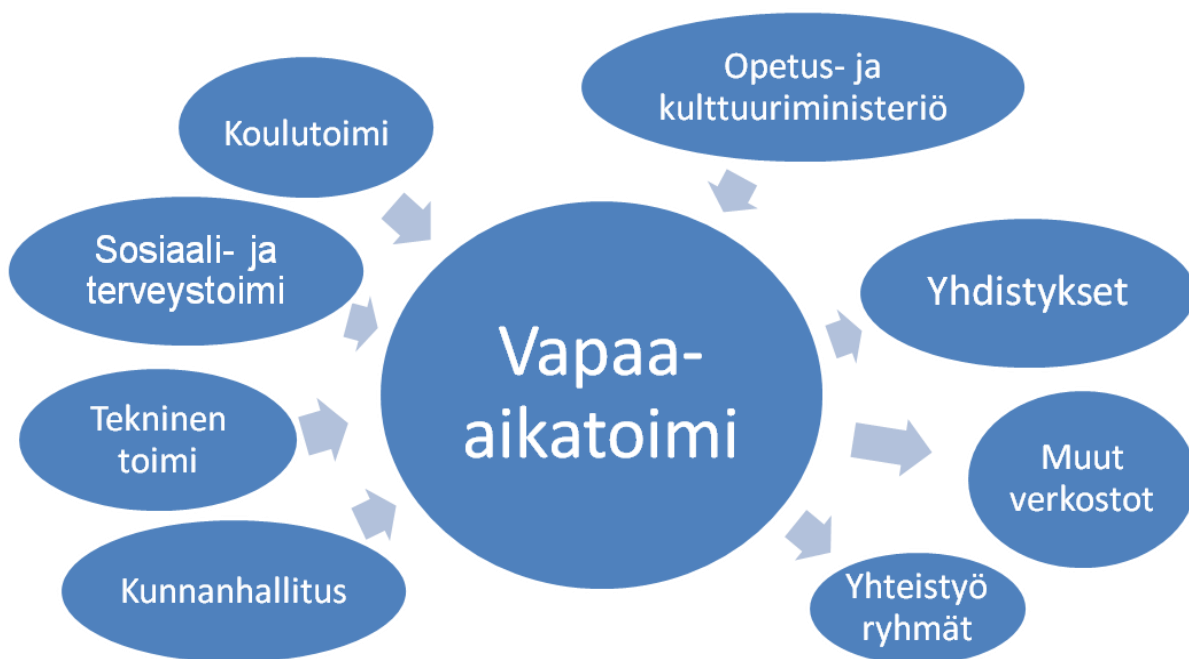
Taulukko 2. Vapaa-aikatoimi omassa toimintaympäristössään (Rasi 2013).

Alla oleva taulukko kuvaa Kaakon kaksikon vapaa-aikapalvelujen toimintaympäristöä ja sen monia erilaisia yhteistyökumppaneita ja verkostoja.