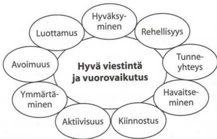
Kuvio 1. Hyvä vuorovaikutus. Mukailten (Kauppila 2005, 72).

Kauppila (2005) kirjoittaa teoksessa ”Vuorovaikutus- ja sosiaaliset taidot” elämän koostuvan lukemattomista sosiaalisista tapahtumista eli vuorovaikutustilanteista. Alla olevaan kuvaan hän on koonnut keskeiset hyvään viestintään ja vuorovaikutukseen liittyvät osatekijät.