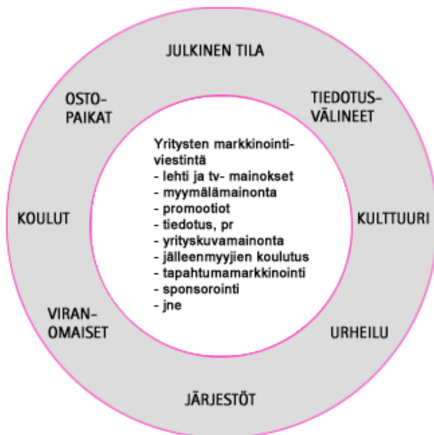
Kaavio 1: Markkinointiviestinnän tavat ja mediaympäristö (Kuluttajavirasto 2013)

Sponsoroinnilla yritys viestii ja tarjoaa sidosryhmilleen kohteen mahdollistamaa imagoa ja palveluja. Sidoryhmät odottavat nykyään yrityksen osallistuvan enemmän yhteiskunnallisten ongelmien ratkaisijoiksi. Yrityksissä on myös tiedostettu, että niillä on laajempi vastuu yhteiskunnasta kuin pelkästään työpaikkojen, tuotteiden ja palvelujen tarjoaminen. (Malmelin & Kuvaja 2008, 116-117.) Yleinen luottamus yrityksiin on laskussa ja sponsoroinnin uskottavuuden vaatimus kasvaa. Yleisö pitää yhä tärkeämpänä yrityksen yhteiskunnallista sponsorointia. Samalla tämä luo myös yritykselle mahdollisuuden erottautua edukseen persoonallisissa sponsorointiratkaisuissa, mutta myös eettisyys sponsoroinnissa on tarkemman tarkastelun alla. Sponsorointi on keino yritykselle osoittaa käytännössä yrityksen arvoja. (Valanko 2009, 119.)