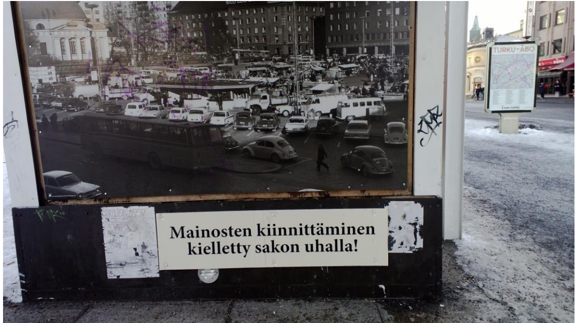
Kuva 4. Turun kauppatorille ei enää levitetä julisteita.