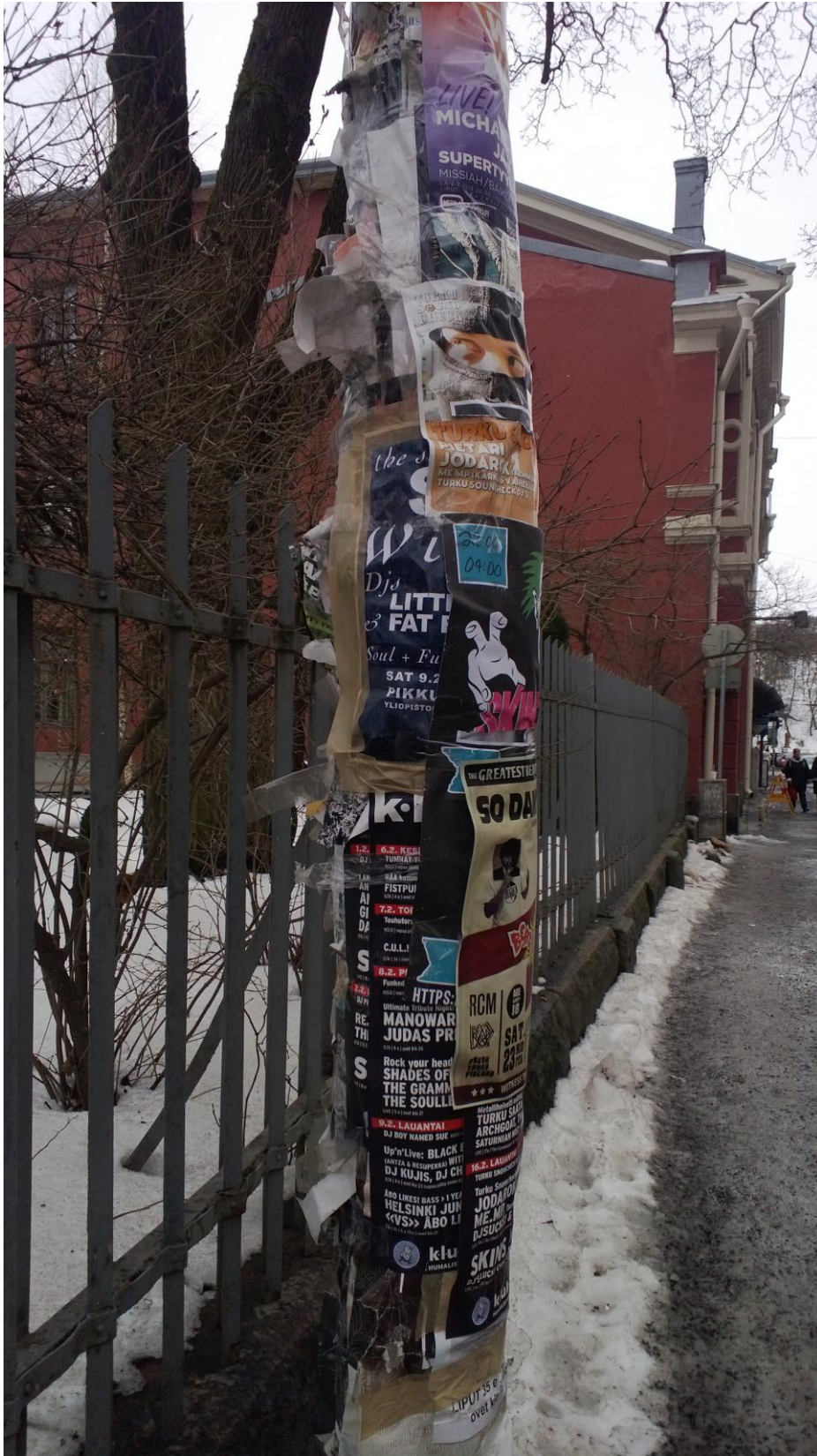
Kuva 5. Julisteiden levityskielto ei haittaa kaikkia toimijoita.