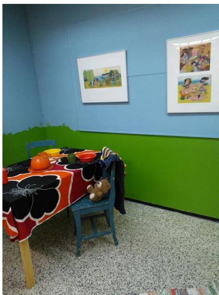
Jason näyttelyä elävöitettiin rekvisiitalla

Tikkurilan kirjastolle järjestettiin tiistaina 23.4 kaikille kirjaston asiakkaille avoin Jason näyttelyopastus ja työpaja klo 18.00. Tuolloin paikalla olin minä, tuottajan roolissa kertomassa toiminnasta ja jakamassa esitteitä syksyn opetuksista ja sanataidekoulusta, sekä Pohjalainen vetämässä avointa näyttelyopastusta ja pajaa satuleikkihuoneessa. Pajassa vieraili yhteensä 23 henkilöä ja illan aikana saatiin mahdollisia uusia asiakkaita 4-6-vuotiaiden ryhmään. Illan päätteeksi näyttely purettiin ja pakattiin puukolliin odottamaan rahtia, jonka tauluille olin seuraavaksi aamuksi tilannut.