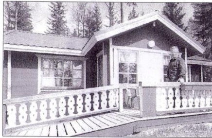
Heikki Soilonen tarjoaa matkailijoille mökkimajoitusta luonnon keskellä Loma-Soiluissa Vilppulassa.

Hotelli Casa Miasta löytyy yhteensä 13 yhden tai kahden hengen huonetta sekä yksi kolmen hengen huone. Huoneissa on myös lisävuodemahdollisuus ja