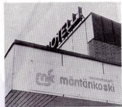
Bio Säte tontille rakennetaan ensi vuoden aikana uusi hotelliravintola. Kadun toisella puolella oleva Hotelli Mäntänkoski jatkaa toimintaansa. Vanha ja uusi hotelli tarjoavat aikanaan majoitustilaa 100 hengelle.

"Hotelli-yritys rakentuu pitkälti perheyrittäjien pohjalta. Oma nanoksem-