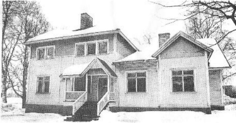
Mäntän Koskelanlammen rannalle Aleksanterinlinnaa tulee kevään kuluessa ruokaravintola, joka on suunnattu aikuisväestölle.