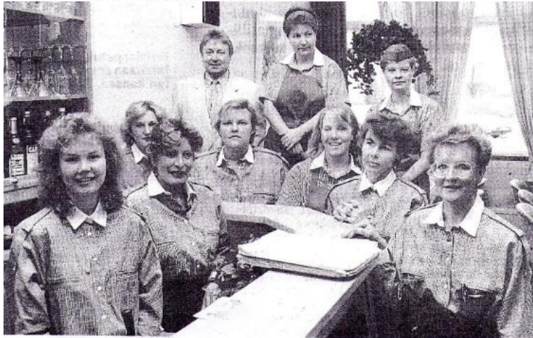
Kaikki viimein valmiina. Katajan Pentillä tyttöineen on syytä hymyyn.