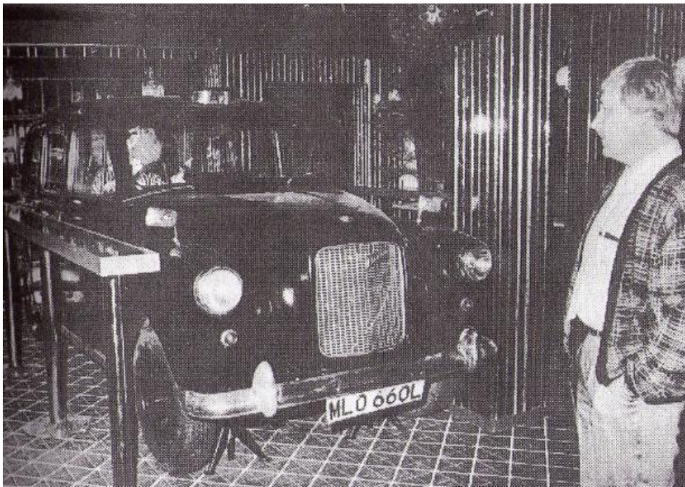
KMV- lehti 29.5.1986