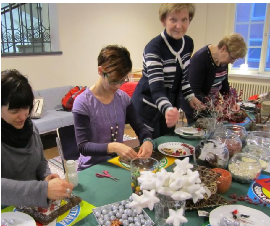
KUVA 8 Tekemisen meininkiä joulukranssikurssilla 2012

”Se oli elämys” Kurssikonseptin kehittäminen Tampereen kaupungin nuorisopalveluille, Monitoimitalo 13:een.