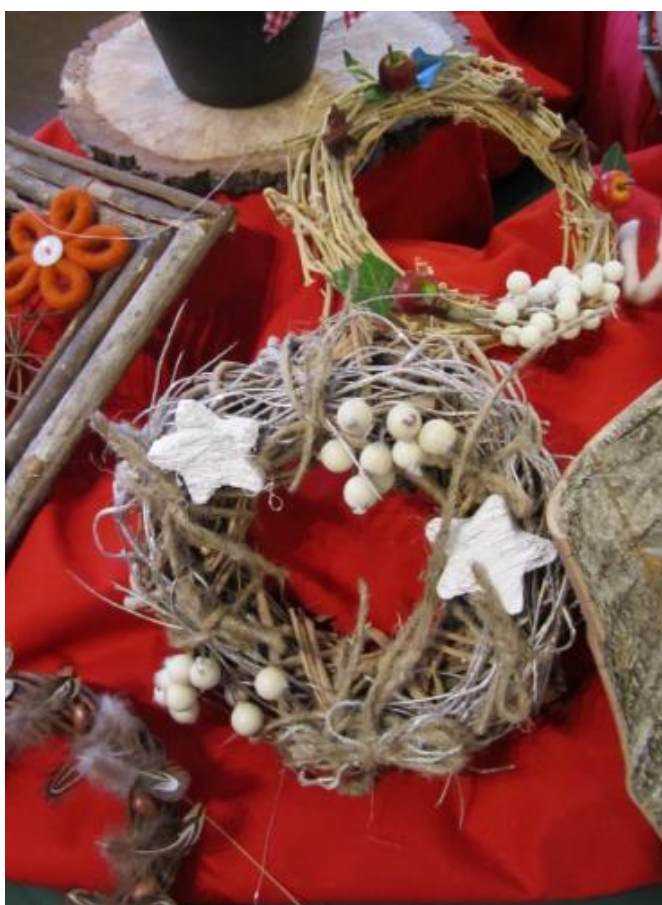
KUVA 9 Kranssimalleja kurssia varten 2012