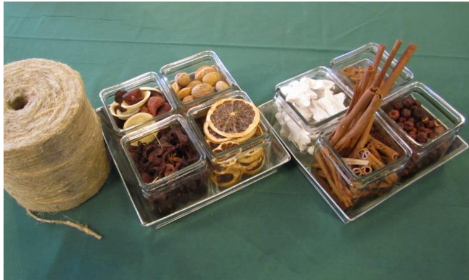
KUVA 7 Luonnonmateriaalia kranssikurssilla 2012

Välineinä pidin palvelumuotoilusta ja siinä elämyskolmion käytöstä, koska se sai itseni ajattelemaan kurssin suunnittelua kokonaisvaltaisesti sekä vielä enemmän asiakkaan näkökulmasta. Uskon, että kaikella tällä oli merkitystä siihen, että asiakkaat saivat elämyksellisen tuokion.