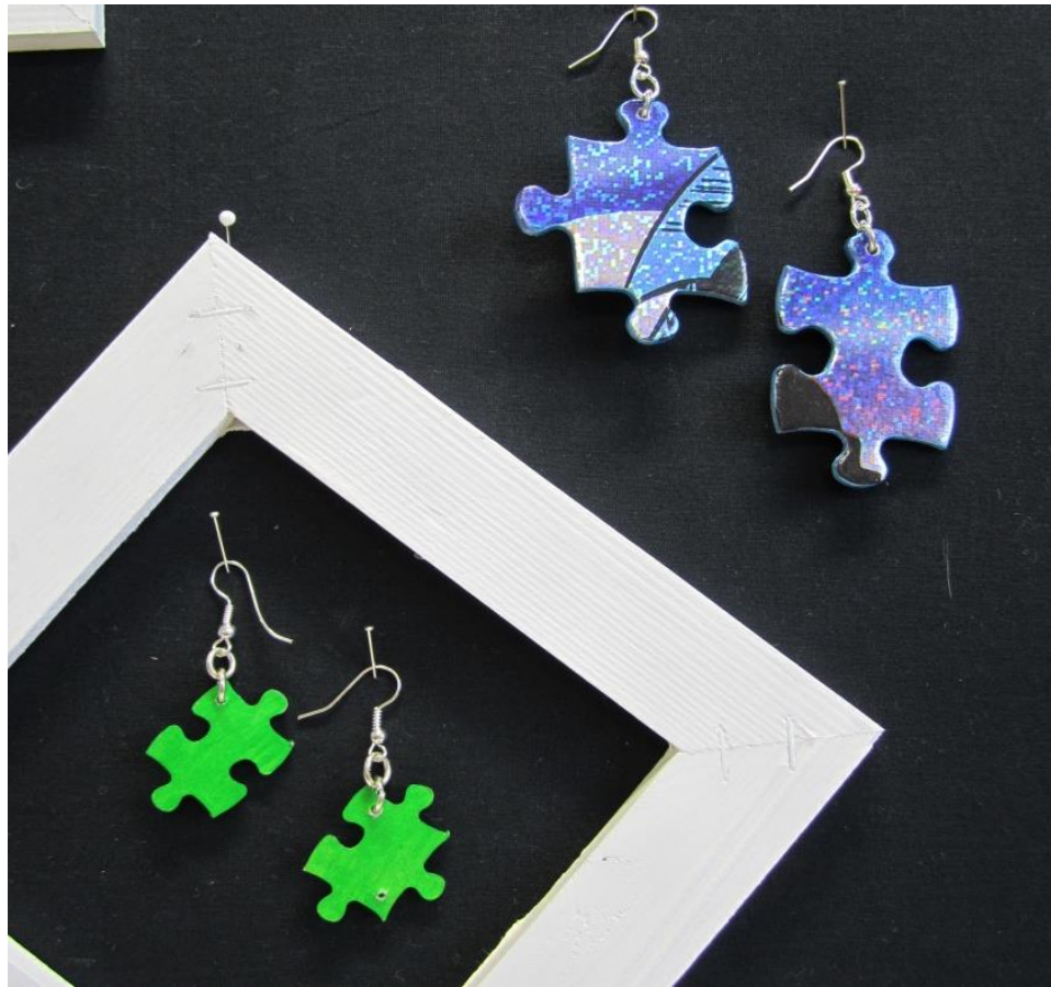
KUVA 3 Palapelikorvakorut kierrätysmateriaalista