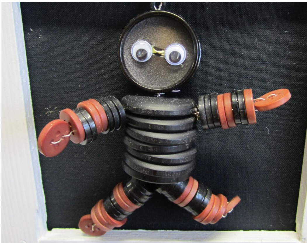
KUVA 2 Nappitaapero kierrätysmateriaalista