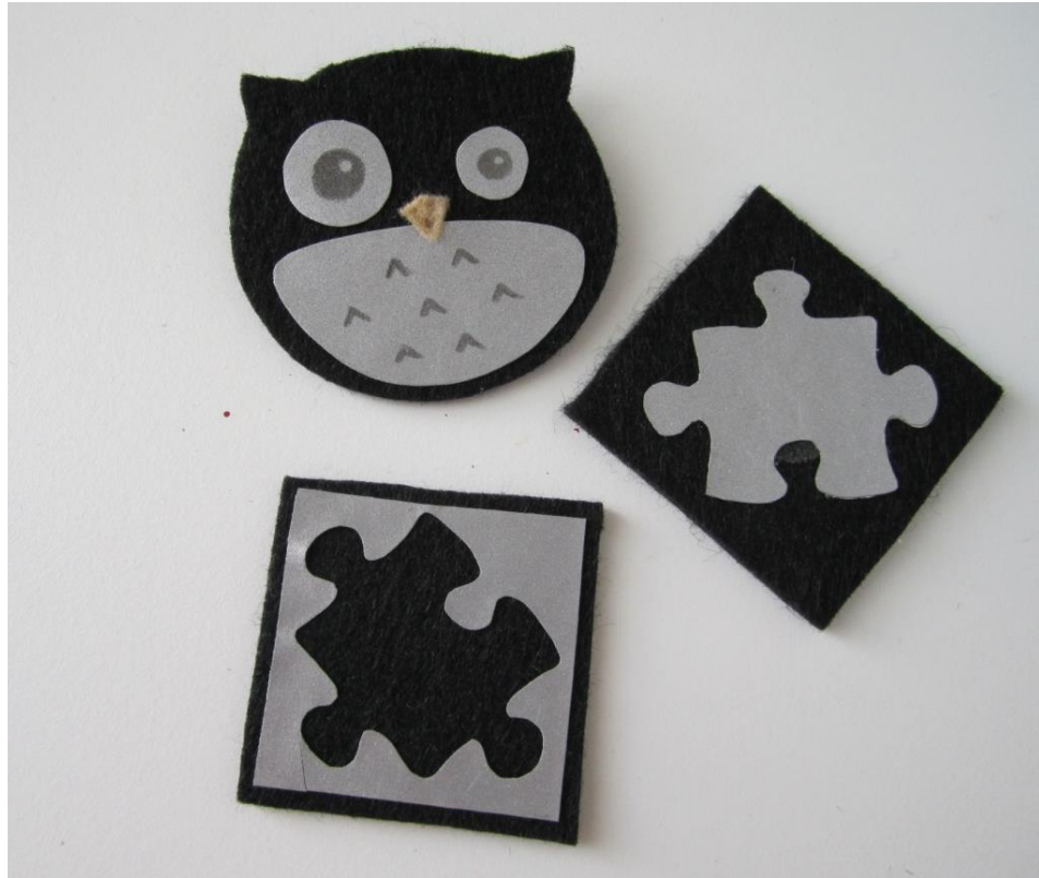
KUVA 6 Aikuisten huopaheijastinmallit