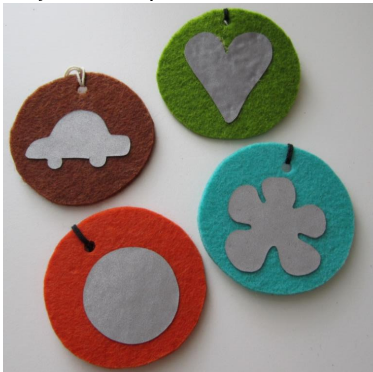
KUVA 5 Lasten huopaheijastinmallit

Valmistamme värikkäitä, erimuotoisia heijastimia konehuopaa, helmiä sekä heijastinkankaita käyttäen.