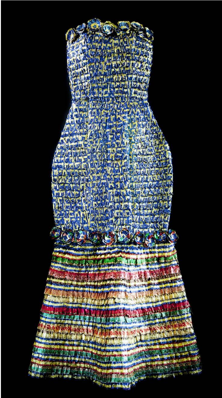
KUVA 5. Juhlapuku. Karamellipaperit, sanomalehti, ompelu, liimaus. 275 x 120 x 55 cm. 2012