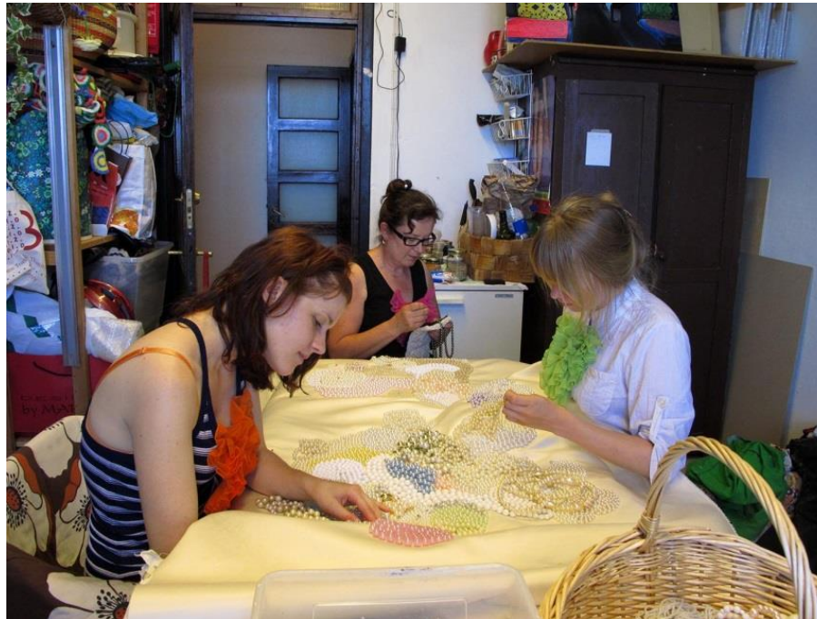
KUVA 9. Minnehaha-teoksen ompelemista.