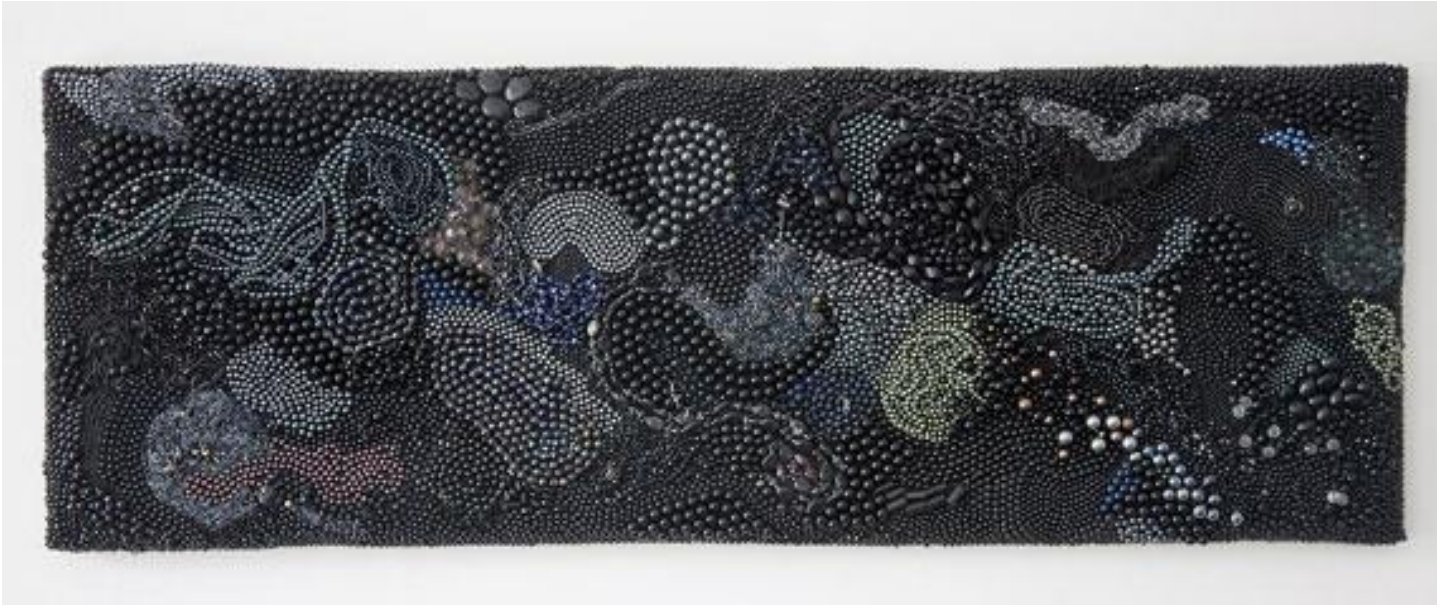
KUVA 4. Akanvirta Korut, tekstiili, ompelu. 58 x 163 cm. 2011