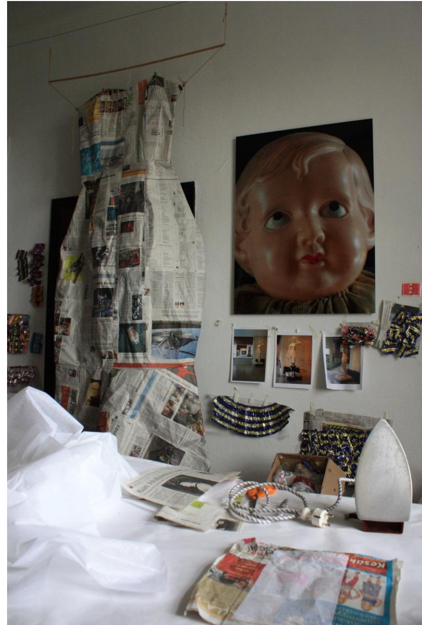
KUVA 8. Juhlapuku-teos Jalostamisvaiheessa, sanomalehdistä valmistettu runko ja rakennekokeiluja.