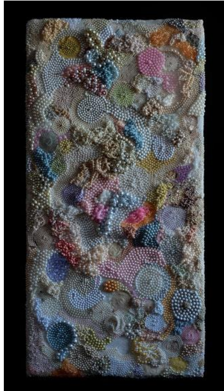
KUVA 3. Minnehaha. Korut, tekstiili, ompelu. 160 x 80 cm. 2011