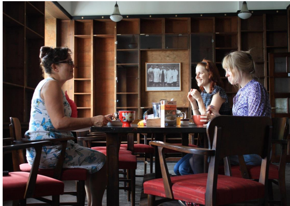
KUVA 6. Aamiainen kirjastossa.

taiteilijatalossa työskentelemisestä, arkielämän havainnoista ja elämästä. Iltapäivällä jatkoimme työskentelyä ja pidimme tarvittaessa teetauon, kunnes päätimme päivän kello 16.30. Jokaisen tekijän työnkuva sisälsi monipuolisen työskentelyn laaja-alaisen osallistumisen. Jokainen osallistui teoksen valmistamiseen, suunnitteluun, materiaalien hankintaan sekä taiteilijatalon yhteiseen elämään. Tekijät olivat osana taiteilijaa ja siten mukana teoksen valmistamisessa.