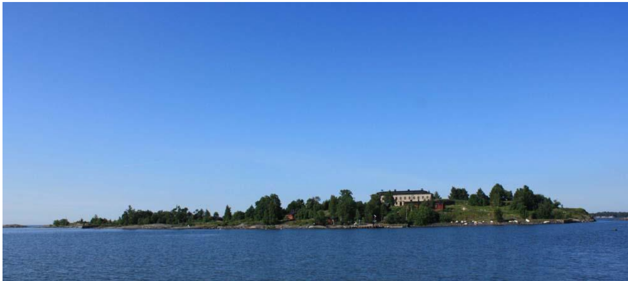
KUVA 1. Harakka-saari

työhuonetta ja taiteenalan tekijöitä on muun muassa tekstiilitaiteilijoita, kirjailijoita ja teollisia muotoilijoita. Harakkan saari sijaitsee aivan kaupungin keskustan tuntumassa, lyhyen soutumatkan päässä. Kulku tapahtuu soutu- tai yhteysveneellä ja talvisin jäätä pitkin. Saari on yhtä aikaa lähellä ja samalla tarpeeksi kaukana, ja sen eristäytyneisyys luo sille ominaista tunnelmaa. (Harakka ry:n www-sivut .) Jatkossa käytän työssäni Harakka-saaresta nimitystä Harakka.