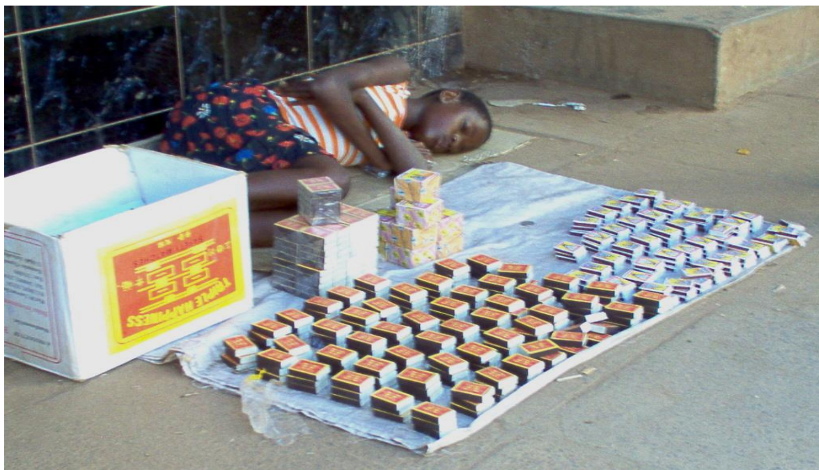
Kuvassa tyttö on nukahtanut kesken tulitikkujen myynnin.

Minua jäi kovasti mietityttämään harjoittelun aikana etenkin lasten heikko asema yhteiskunnassa. Oli ällistyttävää nähdä, kuinka erilaista elämää voi olla toisella puolella maailmaa. Kaduilla näimme eri-ikäisiä lapsia ja nuoria istumassa katujen varsilla kerjäämässä resuiset vaatteet päällään tai tonkimassa jätelavoja. Vanhemmat lapset pysyttelivät ryhmissään kädessään pieni muovipussi, josta he impasivat liiman käryjä lievittääkseen elämän toivottomuutta. Lapset pyörivät kaupungin vilinässä myiden kukkia, koruja, tulitikkuja ym. tavaraa ja vanhemmat lapset kantoivat tavaroita tai kiillottivat kenkiä.