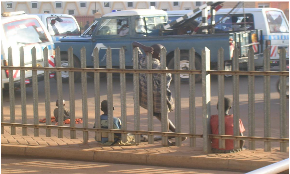
Kuvassa on lapsia Kamalan kadulla kerjäämässä.

Katulasten elämä muodostuu lähinnä jokapäiväisestä selviytymisestä. Kun lapsi ajautuu kadulle, hän hyvin pian liittyy kadulla oleviin katulapsiin. Hänen uudeksi perheeksi muodostuu jengi, joka muodostuu hänen tukiverkoksi kadulla. Jengissä lapsi oppii uudet tavat selviytyä elämässä. Kuvaan tulee varastelu, ruuan etsiminen roskiksista ja kaduilta kerjäämällä, matkalaukkujen kantaminen, sekä markeeteissa auttaminen jne. Katulapsilla on myös suuri riski joutua uhkailun, seksuaalisen hyväksikäytön ja uhrin kohteeksi. (Lubega. 2003, 88)