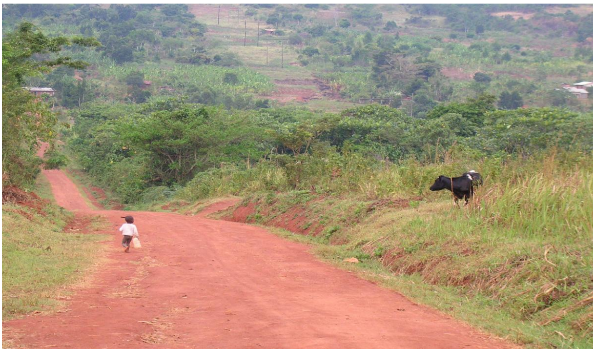
Pienet lapsetkin joutuivat kantamaan kortensa kekoon veden haussa.

Avustusjärjestöt tekevät kehitysmaissa tärkeää työtä lasten oikeuksien parantamisen eteen. Esimerkiksi Suomen World vision: n Ugandan hankkeessa, puhtaan veden saaminen merkitsi lasten elämässä muutosta parempaan suuntaan: uusien kaivojen paikat suunniteltiin niin, että lasten aika vapautuu koulunkäyntiin, eivätkä päivät kulu vedenhakumatkoihin. ( Tervo. 2008)