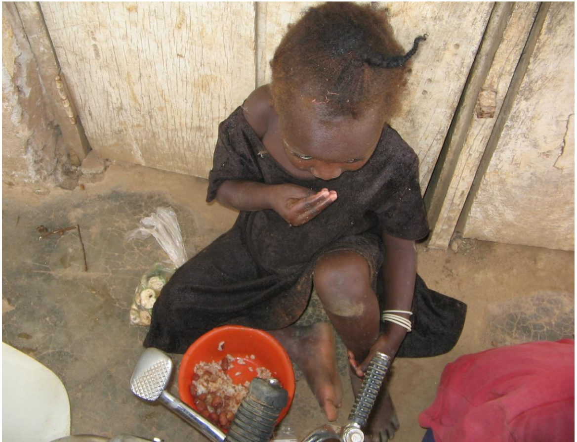
Kuva on otettu Kampalan kadulta. Pieni tyttö on syömässä kadun reunalla.

Jokainen lapsi on luotu suurta tarkoitusta varten - rakastamaan ja saamaan rakkautta. Lapset kaipaavat jotakuta joka hyväksyisi rakastaisi kiittäisi heitä olisi heistä ylpeä. Ellei näin ole, he menevät kadulle... Meidän on haettava lapsi takaisin, annettava hänen tuntea itsensä rakastetuksi.