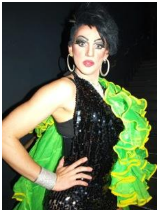
kuva 3. kiinteä salama

En ole koskaan ollut salamavalon ystävä, joten en nytkään halunnut käyttää sitä valokuvissani. Salamavalon käyttö olisi häirinnyt mallejani enkä pidä sen luomista kovista varjoista (kuva 3). Kiinteän salaman käytössä oli myös muita haittapuolia. Se vei kuvistani sen spontaanin tunnelman jonka halusin niihin. Samoin tarkentaminen oli mahdotonta ilman salamaa liian vähäisen valon takia ja salaman kanssa hidasta ja liikaa huomiota herättävää. Päätin siis käyttää hyödykseni niitä vallitsevia valoja joita klubeilla oli käytössä.