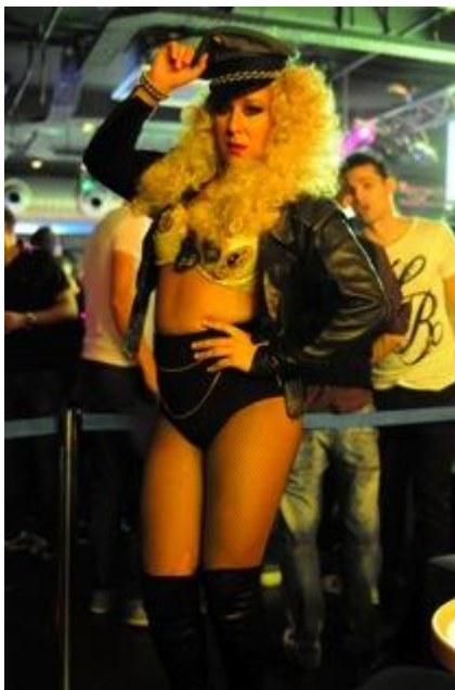
kuva 2. poseeraus

Ehkä helpoin selitys drageilyyn löytyy Hollywood-elokuvista. Niissä aktiivinen katsoja on mies ja nainen on se jota katsotaan (Vänskä, 2006, 40). Drag queenithan haluavat, että kaikki näkevät heidät ja katsovat heitä. On mahdollista, että tätä kautta he hakevat katseen alla olemisen lisäksi heteronormatiivisen yhteiskunnan mukaista haluttavuutta: naisen on oltava seksikäs ja hänen katsomisensa on sallittua ja oikeutettua. (Vänskä, 2006, 109) Kaikkia mallejani yhdistää halu esiintyä naisena varsinkin valokuvissa. Tästä kielivät harjoitellut erittäin punainen-matto-tyyliset poseeraukset (kuva 2). Heillä kaikilla on myös äärimmäinen kamera-tutka, joten ei-poseeraavia kuvia on hankala saada on-stagella. Tämä kaikki kuitenkin kuuluu heidän rooliinsa, joten tavallaan tätä kautta ne ovat ”aitoja” reaktioita, koska kuvat ovat oleellisia minuuden esittämiseksi samoin kun visuaaliset kokemukset ovat itsetietoisuuden keskeisiä elementtejä. (Vänskä, 2006, 94) Poseeraamisen kautta he kokevat olevansa enemmän naisia ja valokuvat ovat todiste heille siitä, heidän todellisuutensa.