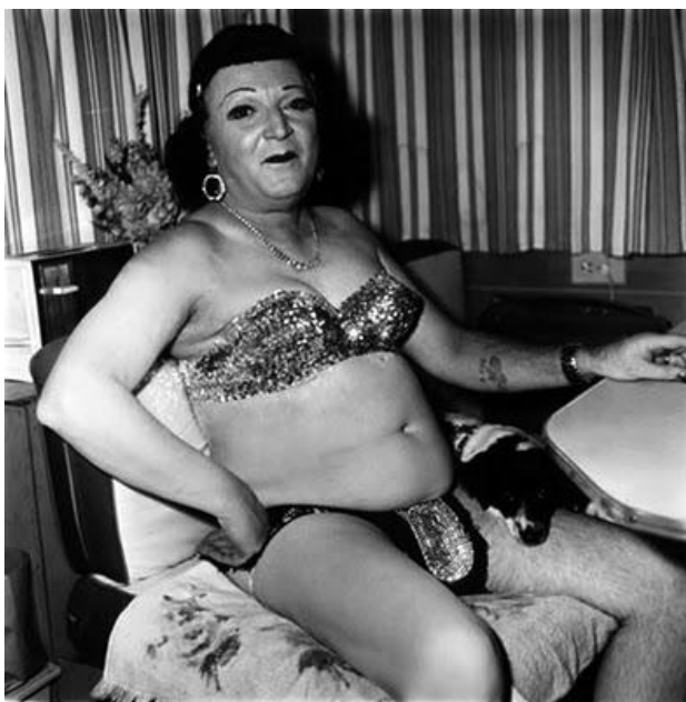
kuva 1. Diane Arbusin valokuva (The Photographers, 2013)

Omat motiivini kuvata kiteytyvät tuohon lauseeseen Diane Arbusista. Minua toki kiinnostaa ihmiset ja se mitä heidän päässään liikkuu, mutta kuitenkin intoni heitä kohtaan johtuu heidän ulkoisesta habituksestaan.