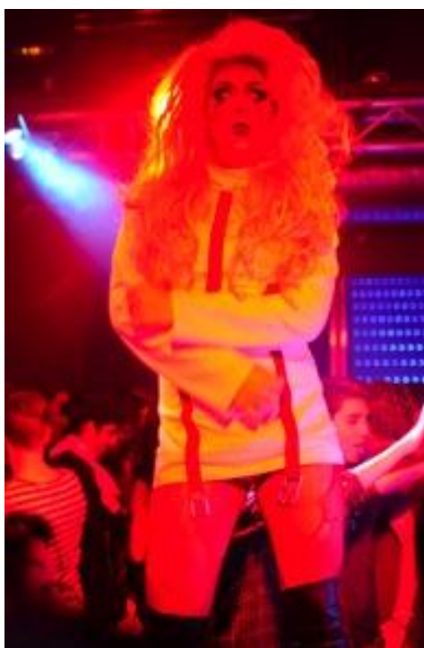
kuva 4. värillinen valo

Suurin haaste oli vallitsevan valon muuttuminen jatkuvasti tai niiden väriskaalan runsaus. Valmistautuessaan malleillani oli vain yksi jatkuva päävalo, joten niiden kanssa pystyi hakemaan oikeaa värimaailmaa kuviin. Lavalla puolestaan oli useasti samaan aikaan valkoista ja vihertävää valoa sekä näiden lisäksi strobon tyylisiä liikkuvia valoja sekä punaista tai sinistä huomioväriä. Nämä vaihtelivat esiintymisen mukaan, joten värien määrittely näihin oli hieman hankalaa kuvaustilanteissa. Osassa kuvissa väri on niin vahva, etten halua edes tehdä asialle mitään vaan koen sen syventävän kuvaa entisestään poistamalla liiallisen väri-informaation kuvasta ja luomalla kovia kontrasteja (kuva 4).