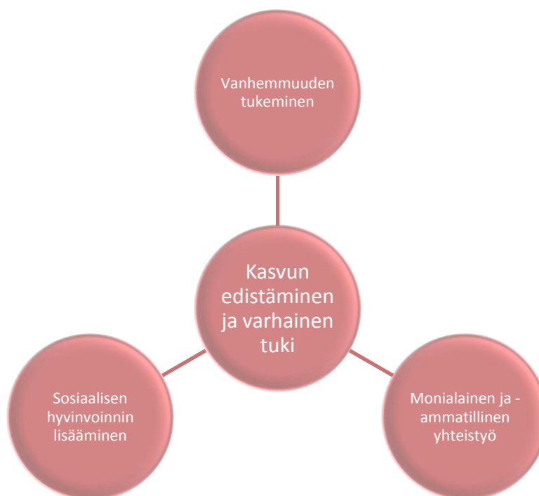
Kuvio 2: koulukuraattorin työn ydin lainsäädännön ja ohjeistusten perusteella.

Wallin (2011, 97) määrittelee koulukuraattorin työn ytimen lainsäädännön ja ohjeistusten perusteella näin: