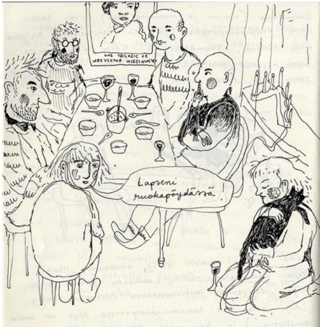
Kuva 6. Kuva, joka onnistui.