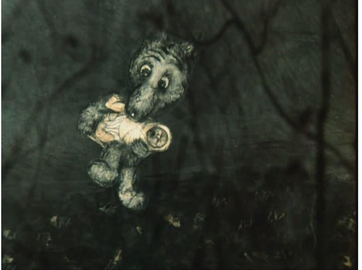
Kuva 1. Kuva Yuri Norsteinin elokuvasta Satujen satu (Skazka Skazok, 1979).

Toisaalta animaatio pyrkii harvoin olemaan todellisuuden suora representaatio. Animaatiolle on tyypillistä kaikki outo ja yllättävä, mitä tosielämässä ja live-elokuvassa ei voi tapahtua. Samoin kuten saduissa, animaatiossa todellisuuden rajat venyvät ja paukkuvat, eikä katsoja silti menetä tunnepitoista kiinnostustaan tapahtumiin – toivottavasti.