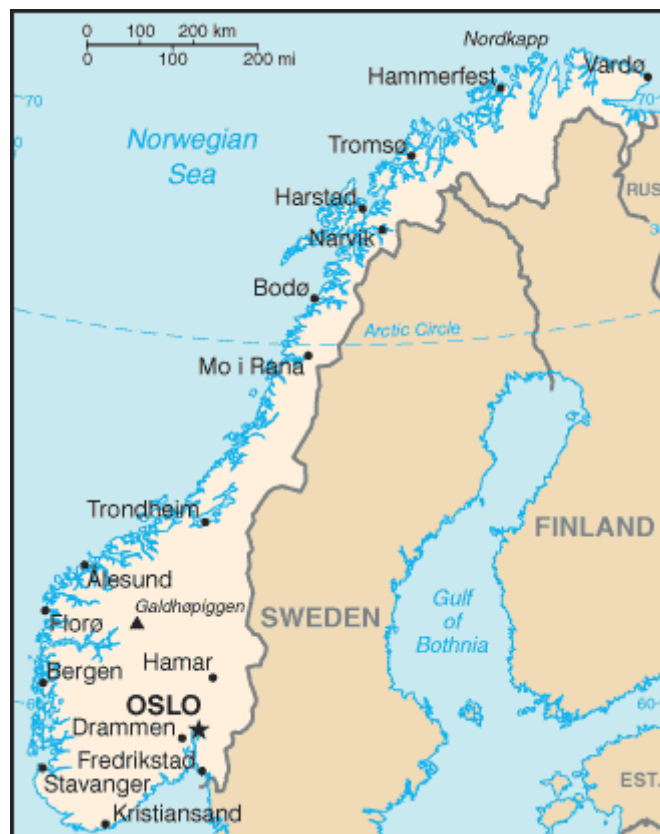
Kuva 1. Norjan kartta ja suurimmat alueelliset kaupungit (Wikicommons 2006).

Norjan kuningaskunta (Kongeriket Norge) on perustuslaillinen monarkia ja pinta-alaltaan ja väestöltään kolmanneksi suurin Pohjoismaa (Pohjola-Norden 2013). Valtion pinta-ala on 385 199 km 2 ja väkiluku oli 5 067 000 helmikuussa 2013. Suurimmat kaupungit ovat pääkaupunki Oslo (613 285 as.), Bergen (256 600 as) ja Trondheim (170 936 as.), jotka ovat nähtävissä alla esitetyssä kartassa. (Ulkoasiainministeriö 2013.)