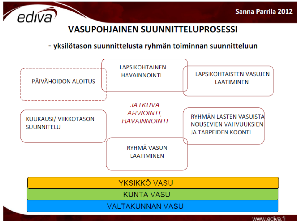
Kuvio 2. Vasupohjainen suunnitteluprosessi – yksilötason suunnittelusta ryhmän toiminnan suunnitteluun. Koulutustilaisuus, Seinäjoki. (Parrila2012)

Miten perheitä sitten kuullaan ja miten heidän toiveensa ja tarpeensa otetaan huomioon käytännön varhaiskasvatustyössä? Kaukoluoto (2010) on pohtinut tutkimuksessaan ” Onko varhaisen tuen päiväkotiki mahdollinen?” vanhempien kanssa käytävien lasta koskevien keskustelujen tarkoitusta ja hyötyä. Tutkimus osoitti, että työntekijän ja vanhemman keskustelussa vuorovaikutus oli sujuvaa, keskustelijoiden arvot samansuuntaisia ja suhde tasavertainen ja arvostava. Päällisin puolin keskustelu näyttää sujuneen hyvin, mutta kuuleeko ammattilainen vanhemman puhetta riittäväällä herkkyydellä, syvyydellä ja merkityksellisyydellä. Tutkijan mukaan toiminta jäi avoimeksi, vaikka vanhemmalla oli useita ”vihjeitä” ja ”syöttejä”, joihin kasvattaja olisi voinut tarttua. Lapsi näyttäytyi kokonaisempaan vanhemman kuin kasvattajan puheissa. tutkija toteaaakin, että haasteeksi päivähoiton ammattilaiselle jää rohkeus tarttua oikeisiin asioihin.