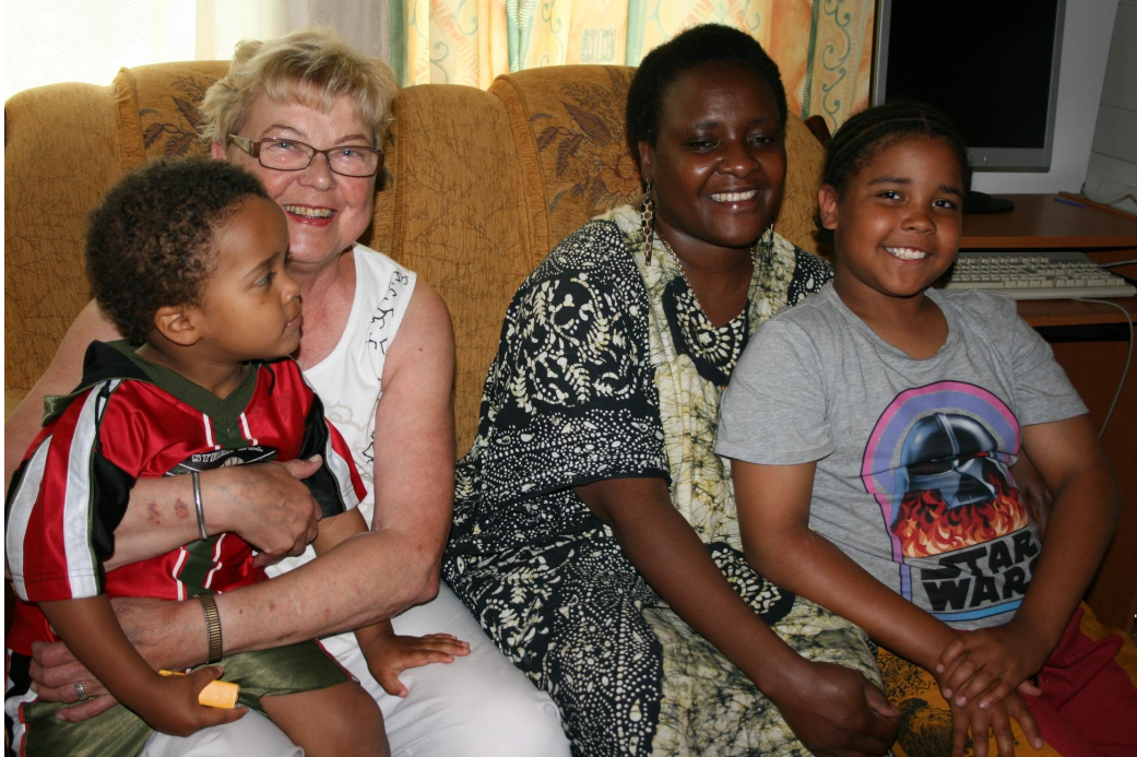
Kuva 1: Viikon paras päivä; mummo tuli käymään!