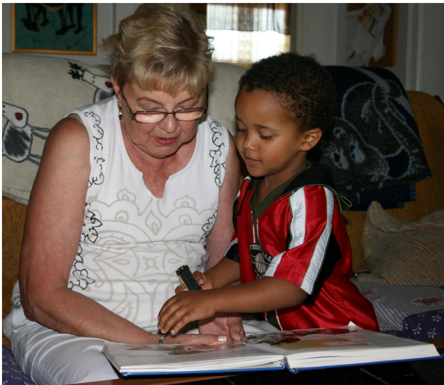
Kuva 2: Suomen kielen vahvistamista.

"Nää on tavallaan asunut jo niin kauan Suomessa, että he hyvin pitkälle on Suomeen jo sopeutuneet ja on sitä mieltä, että lasten on paras niinku mahdollisimman suomalaistua ja he sallivat sen, että lapset ikään kuin suomalaistuvat aika pitkälle." (IF)