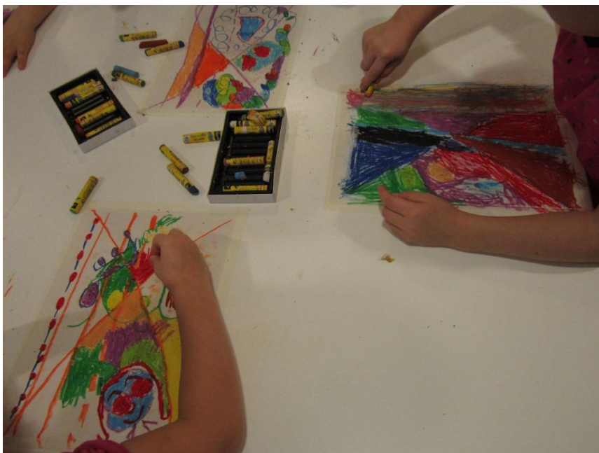
Kuva 13: Väriä ja meininkiä