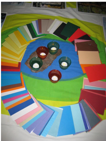
Kuva 8: Värikortteja