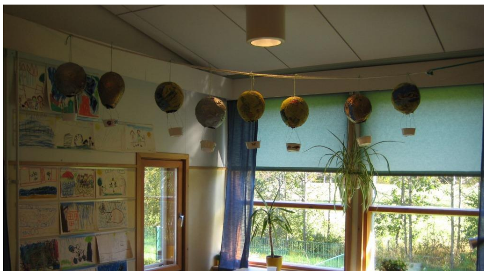
Kuva 4: Valmiit kuumailmapallot

Valmiit kuumailmapallot asetettiin päiväkodin ryhmätilaan näyttille. Lapset olivat omista töistään hyvin ylpeitä. Tällä viikolla moni lapsi kävi ihastelemassa esikoululaisten tekemiä kuumailmapalloja ja esikoululaiset mielellään esittelivät teoksiaan vanhemmille ja kavereilleen. Lapset toivoivat töitä mahdollisimman pian kotiin vietäviksi.