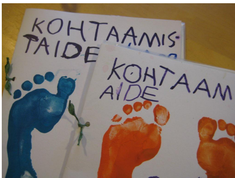
Kuva 20: Varpaanjälkiä

Kohtaamistaideryhmä yhdeksälle lapselle on suuri ryhmä. Viisivuotiaiden kohtaamistaideryhmissä oli kuusi lasta ja ryhmäkoko oli sopivampi ja tuki lapsilähtöisempää toimintamuotoa. Koen itse, päiväkodin aikaisempaan työntekijänä ja harjoittelijana, että kohtaamistaideryhmän toteuttaminen oman työn sisällä on vaativa prosessi toteuttaa, sillä päiväkodissa on hektinen rytmi. Kohtaamistaiderekertojen reflektointi vie oman aikansa ja tämä olisi kokemukseni mukaan parhain tehdä välittömästi ryhmäkertojen jälkeen, jotta toiminta on vielä tuoreessa muistissa. Sen lisäksi kohtaamistaidereissa arvioidaan omaa ohjausta (liite 3.) sekä lapsen aktiivisuustasoa (liite 2.) ryhmän aikana ja näiden lomakkeiden täyttäminen vie oman aikansa. Tein jokaiselle esikoululaiselle oman kohtaamistaidere osallistujakansion, johon kirjasin omia havaintojani lapsesta kohtaamistaidere ryhmässä. Kansioon tuli myös kuvia kohtaamistaiderekerroilta, joissa oli kuvatekstejä ja lapsen omia autenttisia kommentteja ryhmäkertojen aikana. Viimeisellä kohtaamistaidere kerralla lapset painoivat omiin kohtaamistaidere kansioihin omat jalanjäljet. Toivon, että kansion kuvien ja kertomusten kautta vanhemmat ja lapsi saivat yhteisen kokemuksen kohtaamistaidereesta ja siitä, mitä heidän lapsensa on ryhmässä tehnyt ja kokenut.