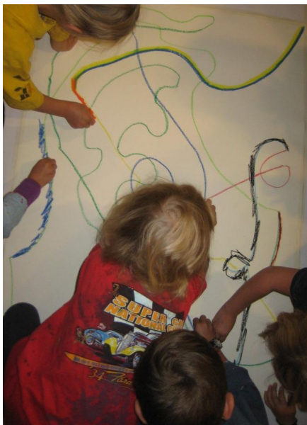
Kuva 1: Lapset lähettävät kirjeitä

kuuluu vuorovaikutusleikkeihin, jossa vuorovaikutus pyritään kytkemään hauskoihin ja iloa tuottaviin hetkiin. (Jernberg & Booth: 20.)