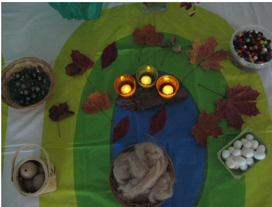
Kuva 5: Moniaistillinen virittäytyminen syksyyn, tunnustelua ja tutkimista

"Mua jännittää miltä toi tuntuu, haisee kamalalta!" Sanna kiemurteli vieressäni. Häntä jännitti villan tunnusteleminen. Materiaalien tunnustelu viritti kaikkia lapsia keskusteluun. Olin yllättyneet: Lapset keskustelivat materiaalien herättämistä ajatuksista.