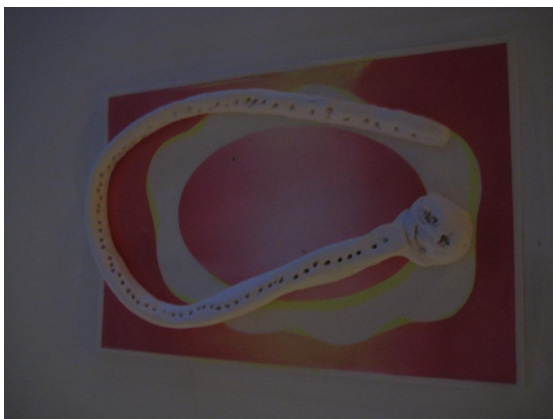
Kuva 10: Booa- käärme