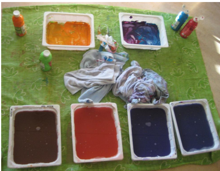
Kuva 17: Ryhmää kuvaavat värit

Painoimme jokaiselle esikoululaiselle omat kannet tulevaan kohtaamistaidekansioon, johon myöhemmin koottiin ryhmässä syntyneet työt. Kuvat painettiin omista varpaanjäljistä. Pienistä varpaanjäljistä tuli ihania ja värit elivät jokaisen lapsen jaloissa erilailla. Lapset auttoivat toinen toisiaan jalkojen pesussa ja kuivaamisessa. Tunnelma oli mukavan rauhallinen ja sujuva. Puhtailla jaloilla lapset sipsuttivat kirjoittamaan omaan kansion kanteen sanan "kohtaamistaide" valitsemallaan tussin värillä ja oma nimi oli tietenkin tärkeä. Myös tässä lapset auttoivat toinen toisiaan, oli ihana huomata kuinka lapset avustivat toisiaan ilman, että ohjaajana minun olisi tarvinnut puuttua heidän toimintaansa. Ilmassa vallitsi ryhmähenki.