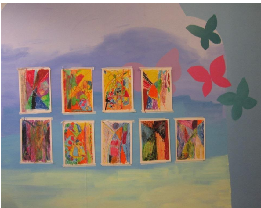
Kuva 14: Valmiit teokset arvostuskierroksella