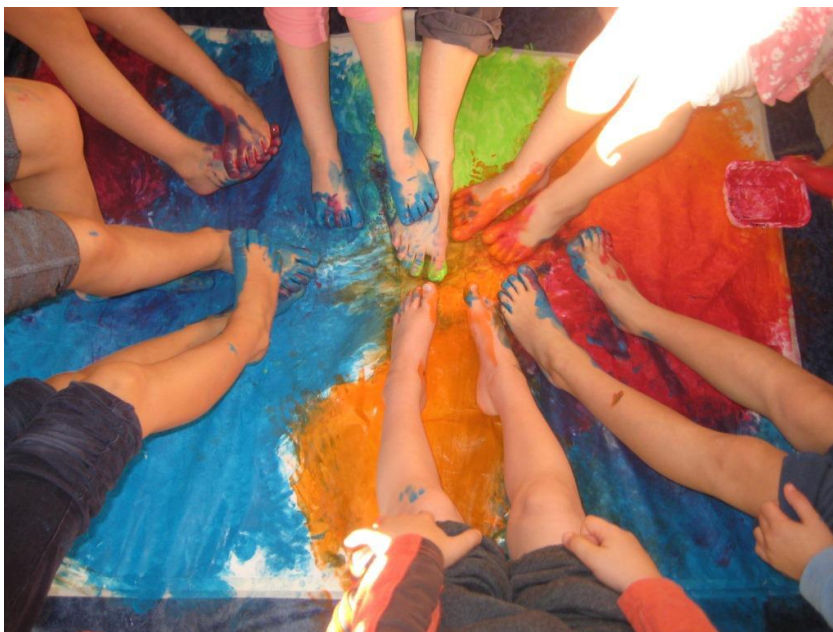
Kuva 16: Hassut värikkäät varpaat