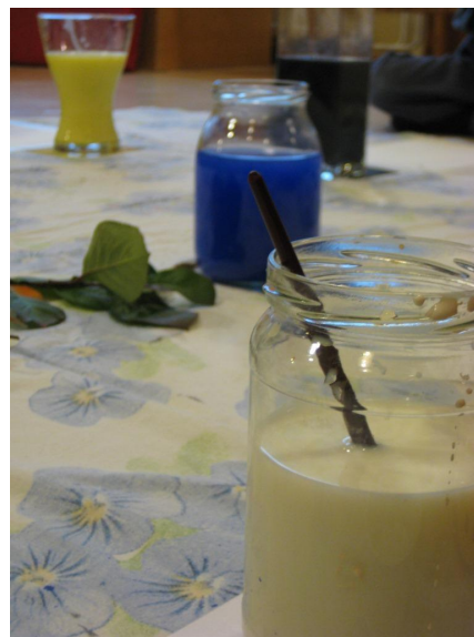
Kuva 9: Lasten tuottamia värejä