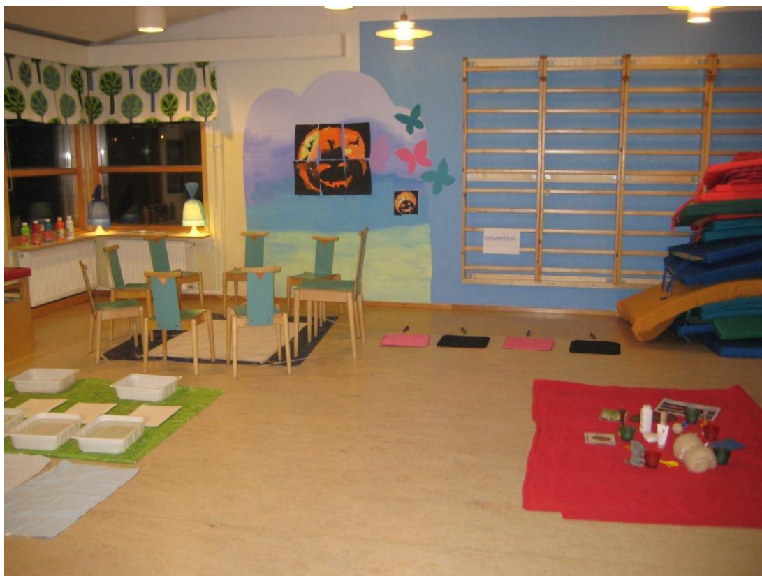
Kuva 19: Kohtaamistaiteen tila

Lapsilla oli paljon erilaisia tunteita liittyen Kohtaamistaiteeseen ja kokemuksiin ryhmässä. Täytyy kuitenkin nostaa esille ne kerrat, kun taidetyöskentely tuntui vaikealta ja arvostuskierroksella lapset eivät olleet tyytyväisiä omiin tai yhteisiin töihin. Ohjaajana en mielestäni hallinnut tilanteita aina parhaalla mahdollisella tavalla ja hankalat tilanteet yllättivät minut. Ryhmän aikana minulle vahvistui tunne siitä, että lapset tarvitsevat turvalliset rajat, joiden sisällä tehdä omia valintojaan ja käyttää omaa mielikuvitustaan. Turvalliset rajat syntyvät varmuudestani toimintaa kohtaan. Esikouluikäisen emotionaalinen kehitys on herkkää aikaa ja mielialat voivat vaihdella. Lapsi tarvitsee aikuista asettamaan hänelle rajoja ja hyväksymään tämä kehitysaskel hänessä. (Lautela 2011: 32.) Vaikeat kerrat, joiden lopputulokseen lapset eivät olleet tyytyväisiä, eivät olleet niitä eniten muisteltuja ja mielekkäimpiä kertoja esikoululaisten loppuhaastattelujen mukaan. Eräs näistä kerroista oli esimerkiksi halloween- aiheinen ryhmätyö. Omien havainnointieni valossa totean, että turvallisen ilmapiirin luominen vaatii ohjaajalta hyvän suunnitelman, lisäksi varasuunnitelma sekä tarpeeksi varman työskentelymuodon, jonka ohjaaja hallitsee toiminnan kaikissa vaiheissa. Tällöin on varaa joustaa paremmin lasten toiveiden ja tarpeiden mukaan ryhmässä.