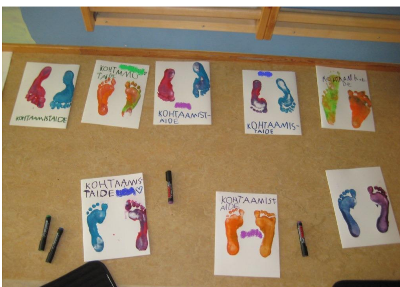
Kuva 18: Lasten tekemät kansiot

Painoimme jokaiselle esikoululaiselle omat kannet tulevaan kohtaamistaidekansioon, johon myöhemmin koottiin ryhmässä syntyneet työt. Kuvat painettiin omista varpaanjäljistä. Pienistä varpaanjäljistä tuli ihania ja värit elivät jokaisen lapsen jaloissa erilailla. Lapset auttoivat toinen toisiaan jalkojen pesussa ja kuivaamisessa. Tunnelma oli mukavan rauhallinen ja sujuva. Puhtailla jaloilla lapset sipsuttivat kirjoittamaan omaan kansion kanteen sanan "kohtaamistaide" valitsemallaan tussin värillä ja oma nimi oli tietenkin tärkeä. Myös tässä lapset auttoivat toinen toisiaan, oli ihana huomata kuinka lapset avustivat toisiaan ilman, että ohjaajana minun olisi tarvinnut puuttua heidän toimintaansa. Ilmassa vallitsi ryhmähenki.