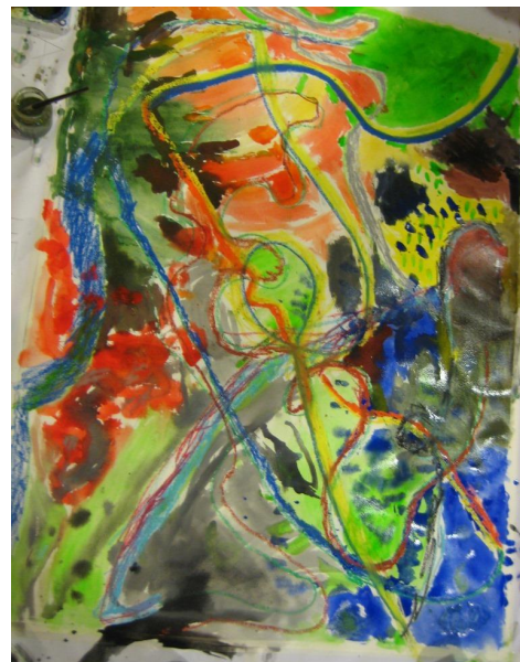
Kuva 2: Lasten yhteinen maalaus

Loppurakentelussa yhteistyö ja neuvottelu rakentamisen edistymisestä olivat lisääntyneet. Lapset tekivät ehdotuksia: "Tehtäiskö näin?" Uusia pareja syntyi ja toiset rakensivat itseksensä. Yhteistyö oli välillä myös haastavaa ja havainnoin, että lapsista ei ollut mukavaa, jos toinen teki toisen työhön sellaista, mitä ei itse olisi halunnut. Lapset ihmettelivät kun ei jatkettu omaa työtä. Toisille lapsista oli vaikea jatkaa toisen työtä tai keksiä miten työtä jatkaisi. Helpompaa oli tehdä kokonaan uusi rakennelma, niin kuin Kertun kohdalla. Mietin jälkepäin, onko tämän tyyppinen tehtävä ollenkaan hyödyllinen tämän ikäisille lapsille, joille oman tilan jakaminen toisen kanssa on vielä haastavaa.