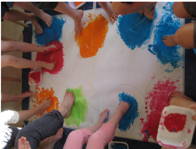
Kuva 15: Tunnustelua varpailla