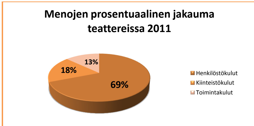
Kuvio 2. Menojen prosentuaalinen jakauma teattereissa 2011 (Tinfo 2013b, 9)

suurimpana ovat tilavuokrat ja sen jälkeen tulevat muut kustannukset, kuten tekniikka, puvustus, lavastus ynnä muut produktiokohtaiset kulut (kuvio 2). Jakauma on yleensä myös harrastajateattereissa hyvin samankaltainen, riippuen siitä työskenteleekö teatterissa lainkaan palkattuja henkilöitä.