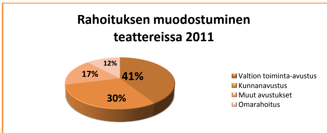
Kuvio 3. Rahoituksen muodostuminen teattereissa 2011 (Tinfo 2013b, 11).

Ammattiteattereista ne, jotka saavat valtionavustusta muodostavat muun rahoituksensa kunnanavustuksista, muista avustuksista ja omarahoituksena. Erona lain ulkopuolisiin ryhmiin, kuten harrastajateattereihin ja pienempiin ammattiteattereihin on pääasiallisesti se, että tulonlähteistä suurimmaksi nousevat usein lipputulot. Yllättävästi valtio tukee tämänkaltaisten teattereiden toimintaa enemmän kuin kunnat ja yksittäisten projektiavustusten prosentuaalinen osuus on suurempi (kuvio 3). (Tinfo 2013b.)