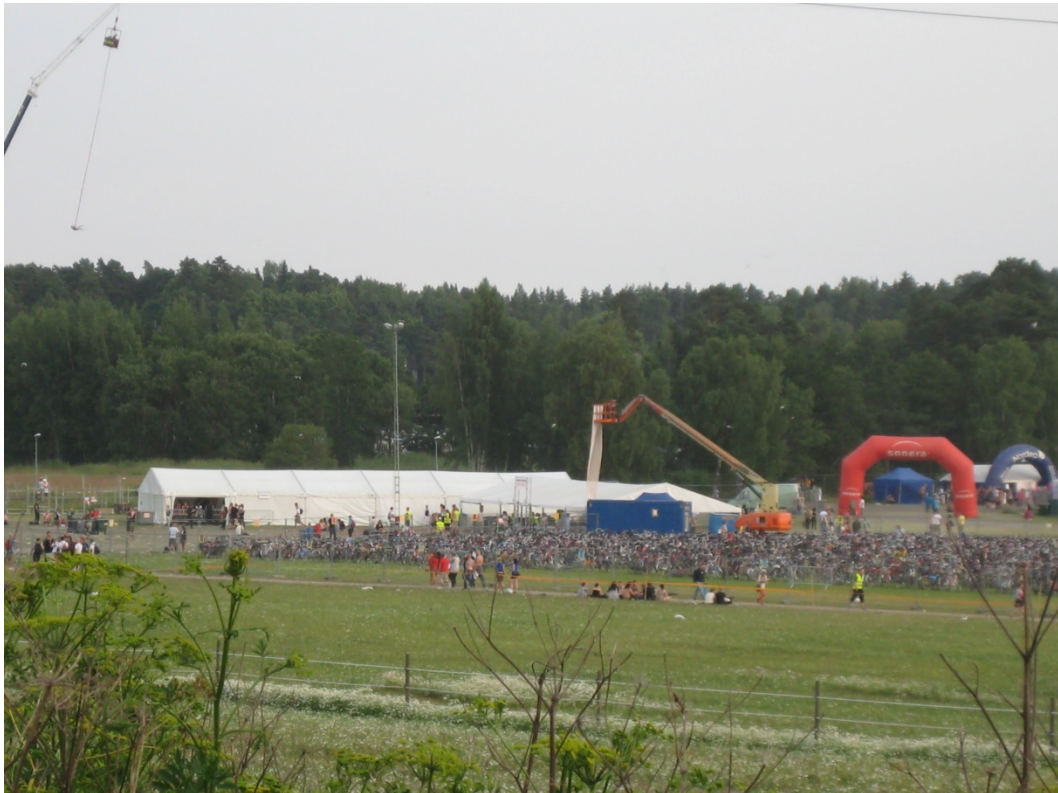
Aidattu kulkuväylä festivaalialueelle.