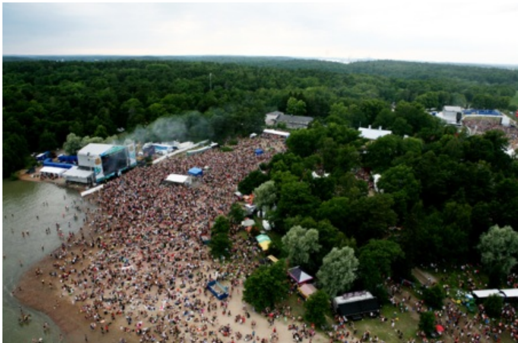
Ilmakuva rantalavan alueelta.