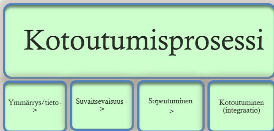
Kuvio 2: Kotoutumisprosessin eteneminen (Myren 1999, 37.)

Myren lähestyy kotoutumisprosessin avulla maahanmuuttajan liikuntaharrastukseen osallistumista. Kotoutumisen alkuvaiheessa oleville maahanmuuttajille olisi suotuisaa järjestää omaa liikuntatoimintaa, joka mahdollistaa vertaistuen ja oman äidinkielen käyttämisen. Osallistuminen liikuntaharrastukseen siirtyy nivelvaiheiden kautta kantaväestön liikuntatoimintaan. Myren korostaa maahanmuuttajien yksilöllisyyttä, jossa osa on valmis osallistumaan heti, kun osa taas ei ole valmiita osallistumaan koskaan yhteiseen harrastukseen kantaväestön kanssa. Myrenin mukaan kotoutumista edistää arjessa tapahtuva välitön vuorovaikutus ja käytäntöä lähellä olevat asiat. Olennaista on, että maahanmuuttaja saa tehdä sellaista, mikä häntä miellyttää, ja johon löytyy oma motivaatio. Urheilu ja liikunta ovat esimerkkejä positiivisesta vaikuttamisesta maahanmuuttajan kotoutumiseen. (Myren 1999, 37.)