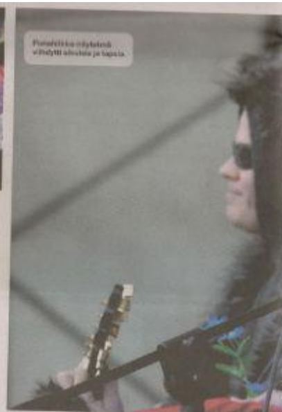
Panahikka-esityksen viihdytti alakoulu ja perheita.

Saari näki aktiivista ihmiskuntaa tapahtuman ohjelmien ja myös tänä perinteon jatkuvan Kajaanissa. Raatihuoneentorilla nähtiin kasaamalla maistokkeita, kassella Kajaani Dancesin tanssi-ohjelmaa ja Kajaani Kaupungin tanssiesitystä Panahikka-esityksiä, jotka saivat ihmiset kukaan-