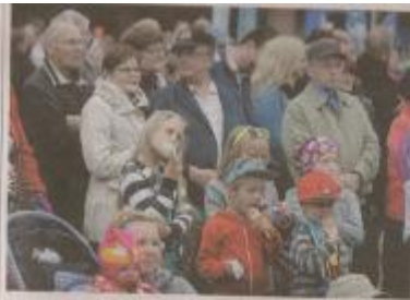
Raatihuoneentori täyttyi kirkkoilata kävijöillä.

Käyttäjät ovat työtökappaleita Kajaanin Sanomista