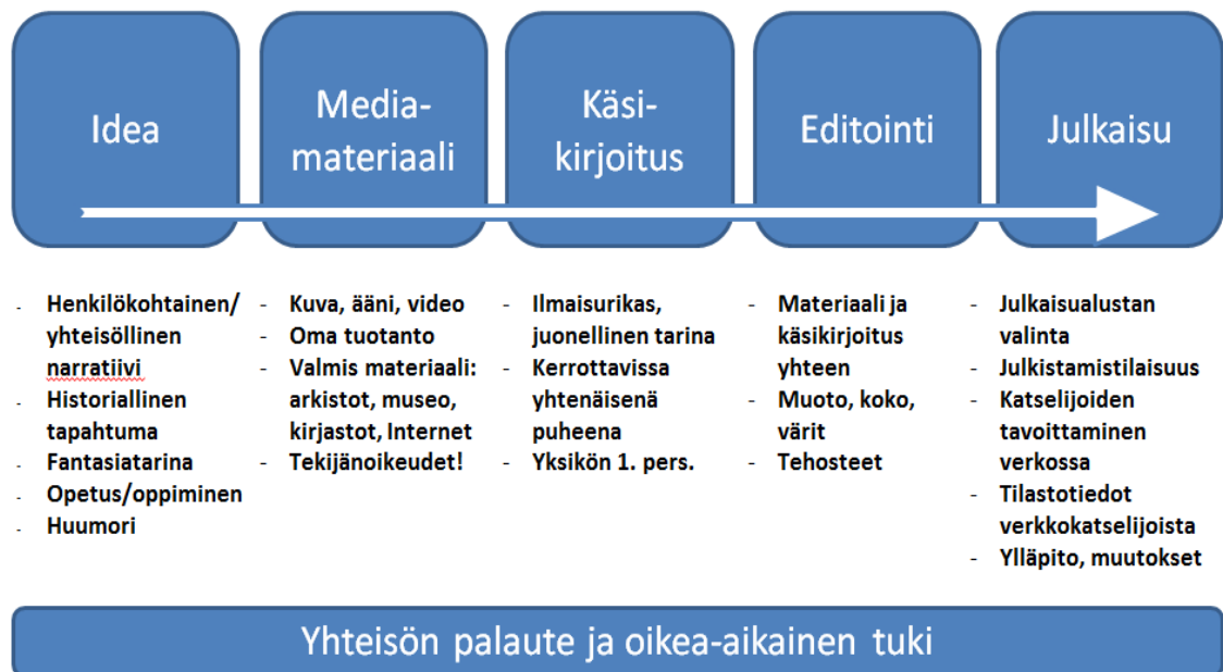
Kuvio 2. Digitarinan projektin vaiheet (Kumpulainen 2011,56).

Digitarinaprojekti koostuu erilaisista vaiheista. Toteuttamistapoja on monia ja eikä ole olemassa yhtä oikeaa toteuttamistapaa. Luova ajattelu ja vaihtoehtoisten toimintatapojen kokeileminen on keskiössä, vaikka vaiheiden määrittelyjä on monia. Kumpulainen (2011) on määritellyt digitarinaprojektin vaiheet kirjassaan näin: