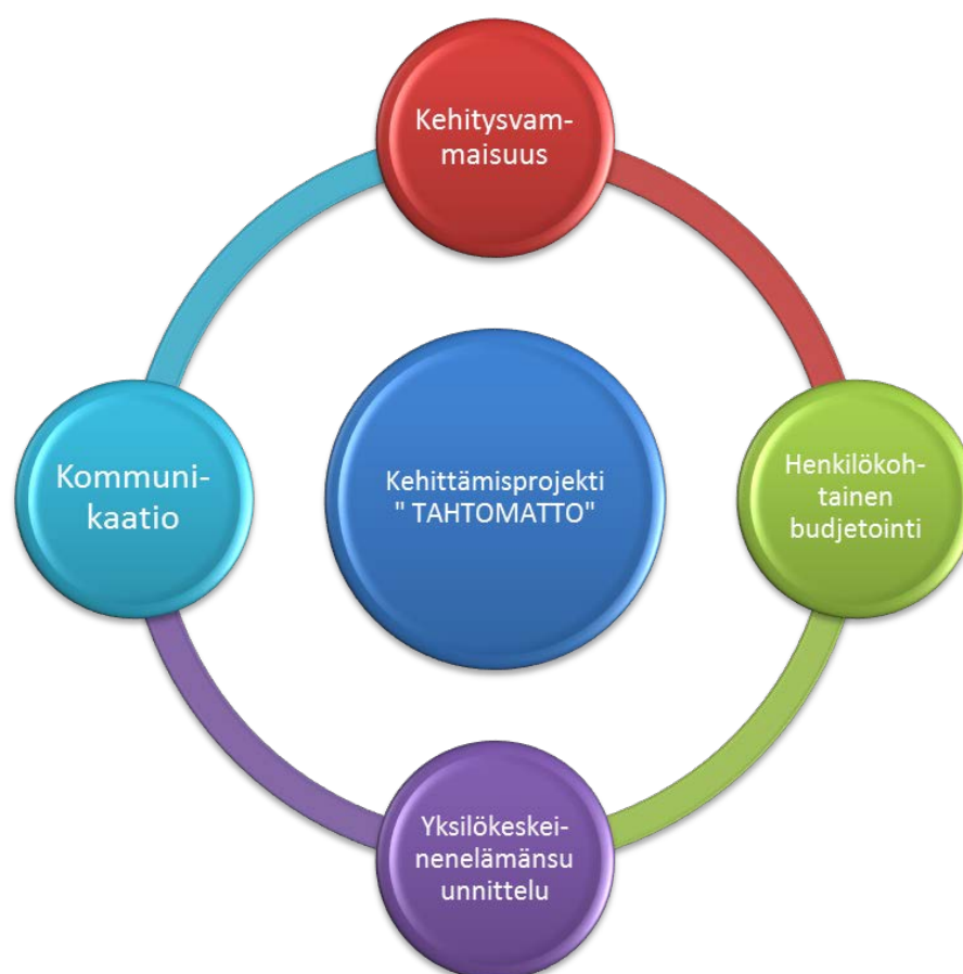
Kaavio 1: Opinnäytetyön teoreettinen viitekehys kaaviona.

Tässä opinnäytetyössä valitsemamme asiakasryhmä on kehitysvammaiset ja kehitysvammatyössä erilaisten puhetta korvaavien ja tukevien kommunikaatiomenetelmien käyttö on melko yleistä, joten niiden tuntemus edesauttaa kehittämisprosessiamme. Sekä yksilökeskeinen elämänsuunnittelu että henkilökohtainen budjetointi liittyvät siihen siten, että opinnäytetyömme kehittämiprojektin tuotteena syntyvä kommunikaatioapuväline, joka myöhemmässä vaiheessa nimettiin Tahtomatoksi, on suunniteltu erityisesti niiden tueksi.