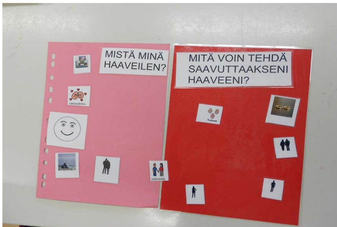
Kuva 6: Pilotointia 1.8.2013.