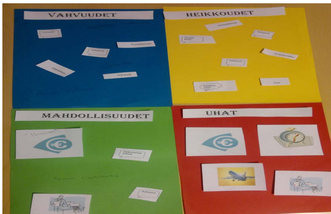
Kuva 4: Tahtomaton käyttöä SWOT-analyysin teossa.

Tahtomatto on erittäin monipuolinen alusta, jonka käytössä on mielikuvituksen käyttäminen sallittua, jopa toivottavaa. Jos alkuun pääseminen on hankalaa, voi ideoita ja materiaalia käydä hakemassa esimerkiksi Papunetin verkkojulkaisusta, jonne on kerätty kattava määrä materiaalia ja ideoita (Materiaalia 2013).