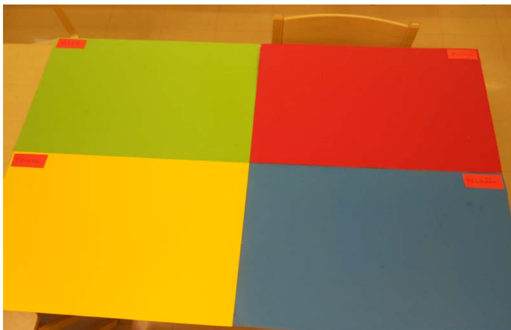
Kuva 1: Tarhupuiston toimintakeskuksen käytössä olevan kommunikaatiovälineen pelilauta.

Tutkimuslupavaiheen jälkeen lähdimme keräämään aineistoa haastatteluin. Ensimmäisenä teimme ryhmähaastattelun Tarhupuiston toimintakeskuksella, joilta opinnäytetyömme aihekin oli lähtöisin. Haastattelutilanteessa oli mukana kolme ohjaajaa kymmenen asiakasta. Sukupuolijakauma ryhmässä oli tasainen ja ryhmän jäsenet olivat toisilleen entuudestaan tuttuja, joten emme kokeneet tarvetta ryhmäyttämiseksi. Tällä ensimmäisellä käynnillä ohjaajat ja asiakkaat esittelivät meille oman prototyypinsä kommunikaatiovälineestä, jota lähtisimme työstämään. Kommunikaatioväline rakentui SWOT-analyysin (Strengths, Weaknesses, Opportunities, Threats) tyyppisen nelikenttämenetelmän ympärille (OPH 2012). Materiaaliltaan se oli kartonkia.