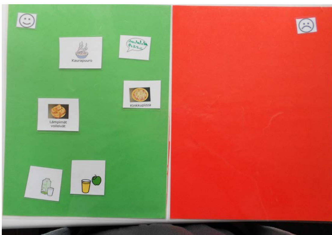
Kuva 5: Pilotointia 16.7.2013.

Ensimmäisessä testipelauksessa paikalla oli yksi asiakas tutun ohjaajan kanssa, sekä opinnäytetyön tekijät, joista toinen veti pelitilannetta ja toinen kirjasi testipelauksessa esiin tulleita huomioita. Pelitilanne järjestettiin erillisessä tilassa ja ympäristö rauhoitettiin pelitilannetta varten.