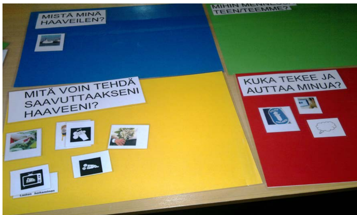
Kuva 3: Esimerkki Tahtomatton eri kenttien otsikoinnista

Se, mikä tekee Tahtomatosta kommunikaatioapuvälineen, on sen tarjoama mahdollisuus siirtää tietoa ja tehdä se näkyväksi. Tässä asiakastyön kontekstissa se tarkoittaa tiedon siirtoa ja näkyväksi tekemistä ohjaajalta asiakkaalle tai asiakkaalta ohjaajalle. Tahtomatton käyttö ryhmässä mahdollistaa saman useammalle ihmiselle kerrallaan.