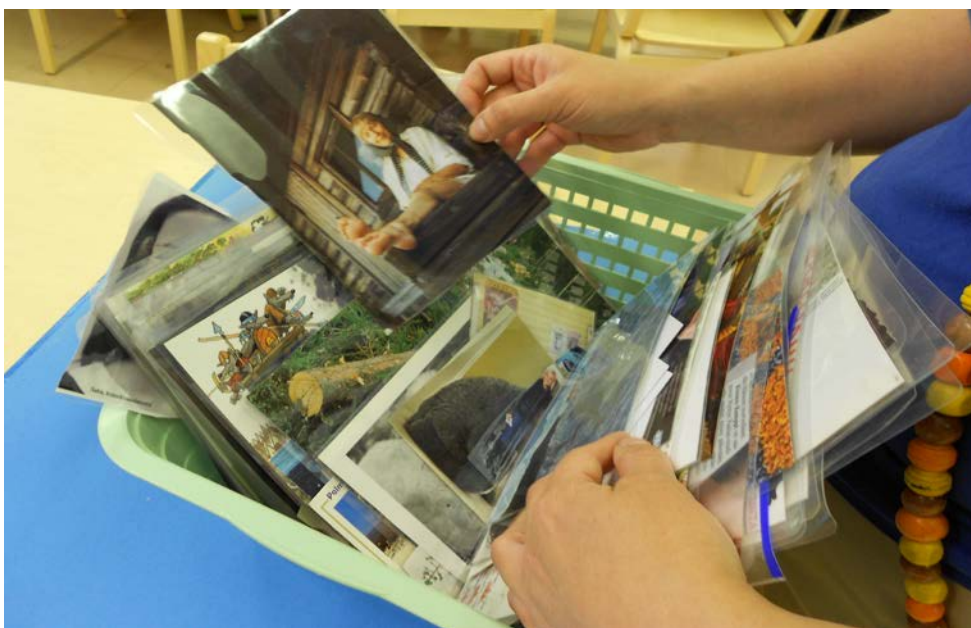
Kuva 2: Tarhupuiston toimintakeskuksessa käytettävät kuvat.

jaajaa, joista toinen vetää pelitilanteen ja toinen kirjaa esiin tulleet havainnot ja huomiot. Tilanteesta riippuen käsiteltävät aiheet liittyvät asiakkaaseen yksilötasolla tai koko ryhmään.